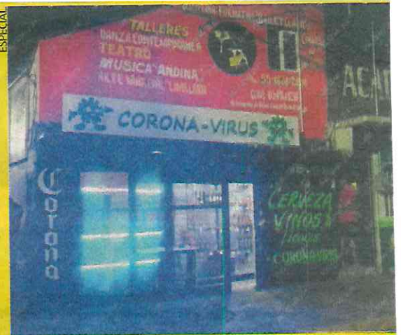
La víctima murió en la vinatería 'Corona-virus'.

El cadáver fue trasladado al anfiteatro de la agencia ministerial.