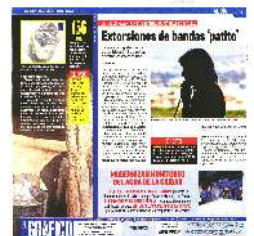
En este año se han recibido 597 denuncias de extorsiones en la CDMX.