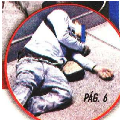
ADRON ABATIDO EN UN OXXO