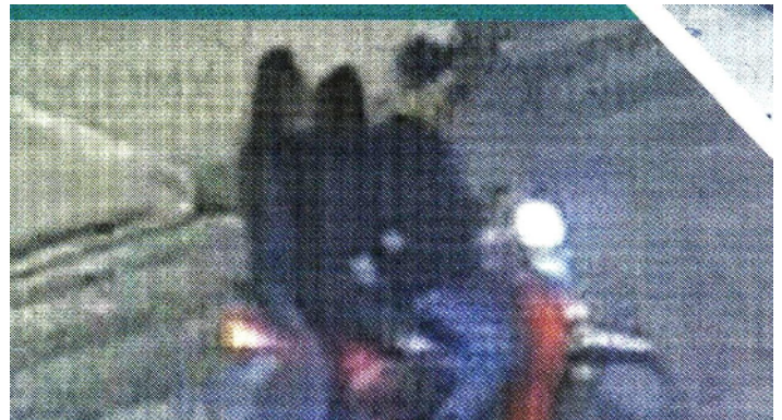
La SSC detectó una banda criminal que usa motocicletas para privar de la libertad a sus víctimas.