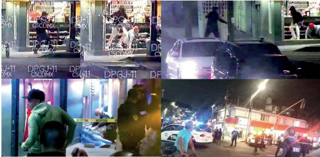
- Todo sucedió en cuestión de segundos