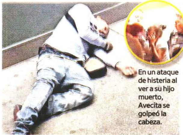
En un ataque de histeria al ver a su hijo muerto, AVECITA se golpeó la cabeza.