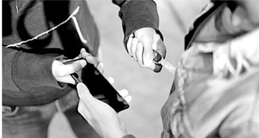
Los capitalinos son despojados de dinero, celulares, relojes y otros objetos de valor