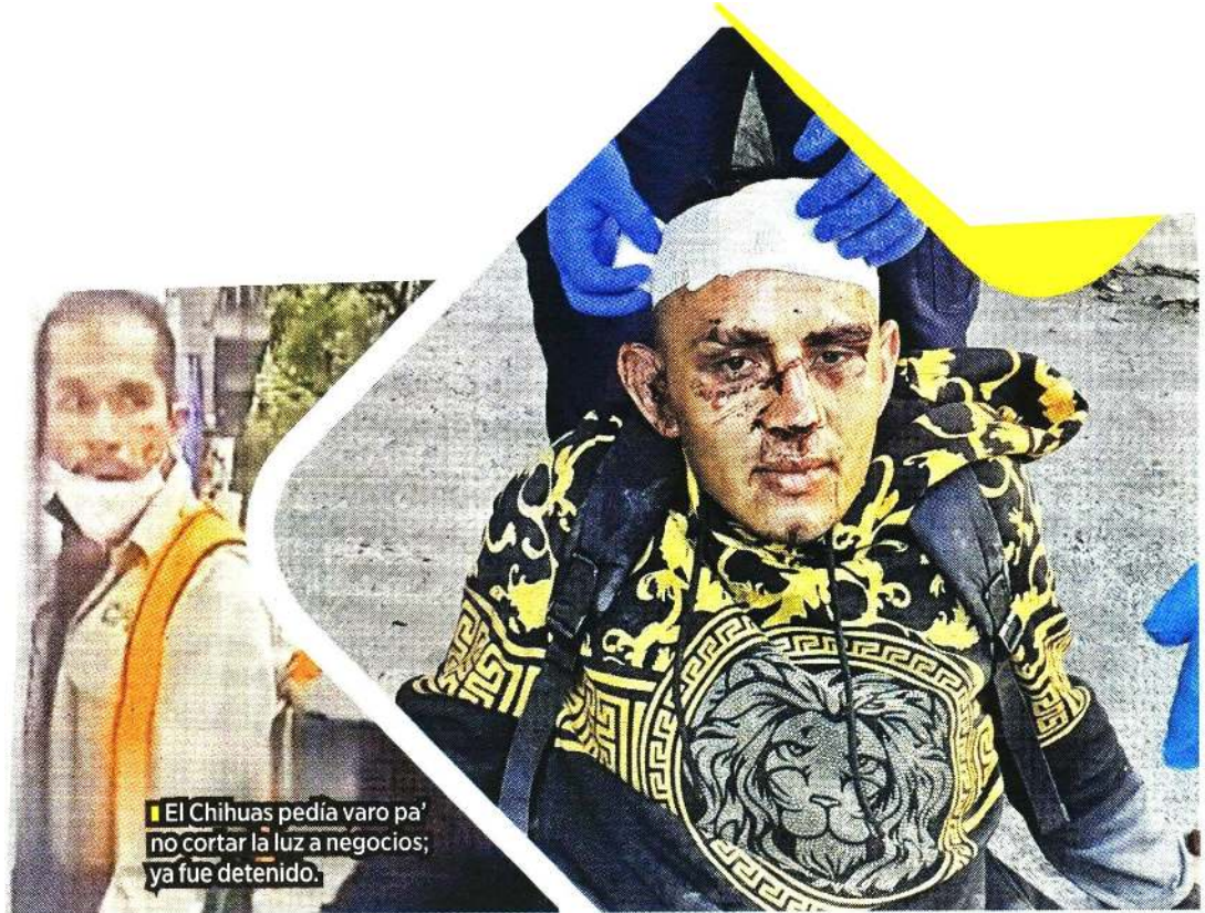
El Chihuas pedía varo pa' no cortar la luz a negocios; ya fue detenido.

Aunque se resistió a la detención, fue sometido y presentado ante la Agencia del Ministerio Público Número 50.