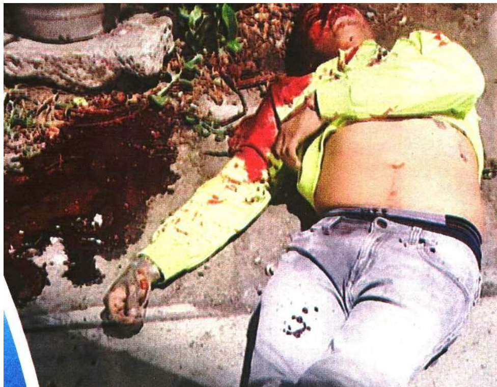
MATAN A UN CHAVO EN LOS PICOS, IZTACALCO

DE UN BALAZO EN LA CABEZA, MATAN A UN HOMBRE QUE ECHABA CHELA CON SUS COMPAS, EN IZTACALCO. PÁGS. 6 Y 7