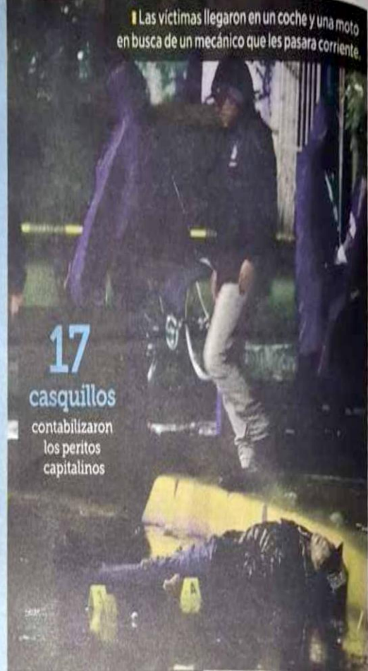
Las víctimas llegaron en un coche y una moto en busca de un mecánico que les pasara corriente.