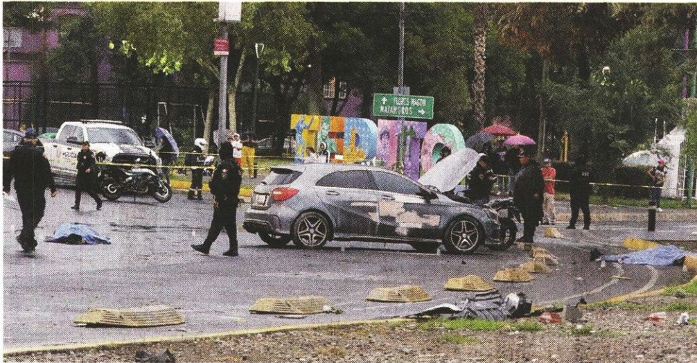
Las víctimas llegaron en un coche y una moto; los peritos contabilizaron 17 casquillos