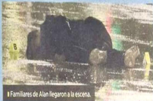
Familiares de Alan llegaron a la escena.

Según las autoridades y las versiones de los testigos, hubo un