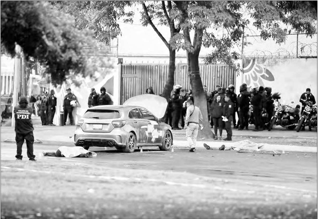
▲ Dos personas fueron ultimadas por sujetos que iban en una moto cuando revisaban el motor de un vehículo sobre Paseo de la Reforma y la calle Matamoros, en la colonia Guerrero.