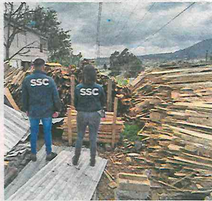
Había madera e implementos para trabajar y desmontar árboles

A la hora de su aprehensión se les aseguraron varias toneladas de madera posiblemente talada de forma ilegal, así como pedacería de troncos y distintas herramientas para corte, tallado y carpintería. Tanto lo asegurado como los detenidos quedaron a disposición del Ministerio Público de la FGJCDMX y en