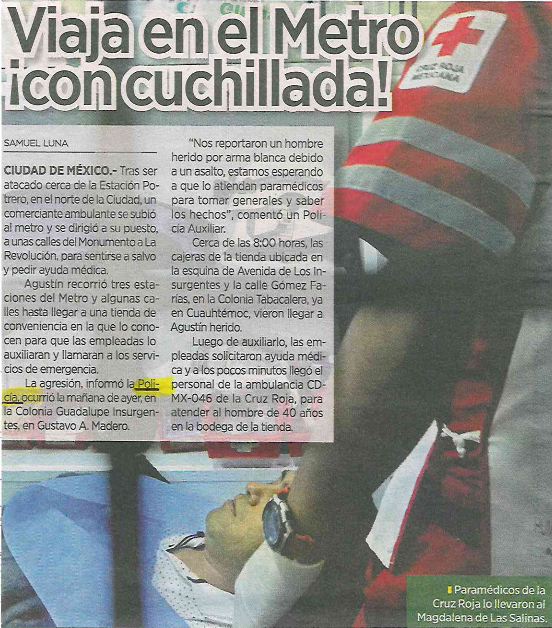
■ Paramédicos de la Cruz Roja lo llevaron al Magdalena de Las Salinas.

Luego de auxiliarlo, las empleadas solicitaron ayuda médica y a los pocos minutos llegó el personal de la ambulancia CD-MX-046 de la Cruz Roja, para atender al hombre de 40 años en la bodega de la tienda.