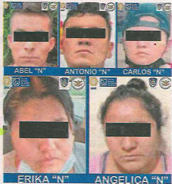
Durante los cateos se detuvo a tres hombres y dos mujeres

Al finalizar los cateos, se detuvo a tres hombres y dos mujeres; dos de ellas contaban con órdenes de aprehensión por su presunta relación con delitos contra la salud. Asimismo, se aseguraron 124 dosis de sustancia blanca con las características propias de la cocaína, y 57 dosis de hierba seca con las características propias de la marihuana, así como 250 gramos de posible cocaína y un arma de fuego.