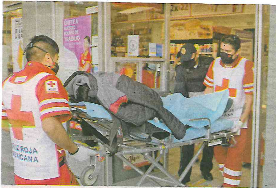
El hombre alcanzó a pedir auxilio en una tienda de conveniencia de la calle Valentín Gómez Farias