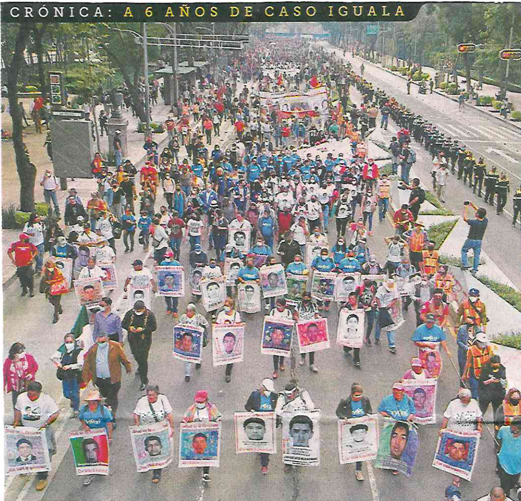
■ Cientos de manifestantes, entre familiares de los normalistas de Ayotzinapa y estudiantes de varios estados del País, marcharon ayer por Paseo de la Reforma.