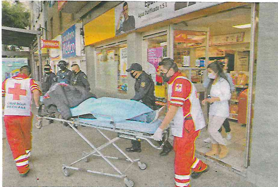
Técnicos en urgencias médicas de la Cruz Roja llegaron hasta la colonia Tabacalera, a donde llegó caminando la víctima de asalto