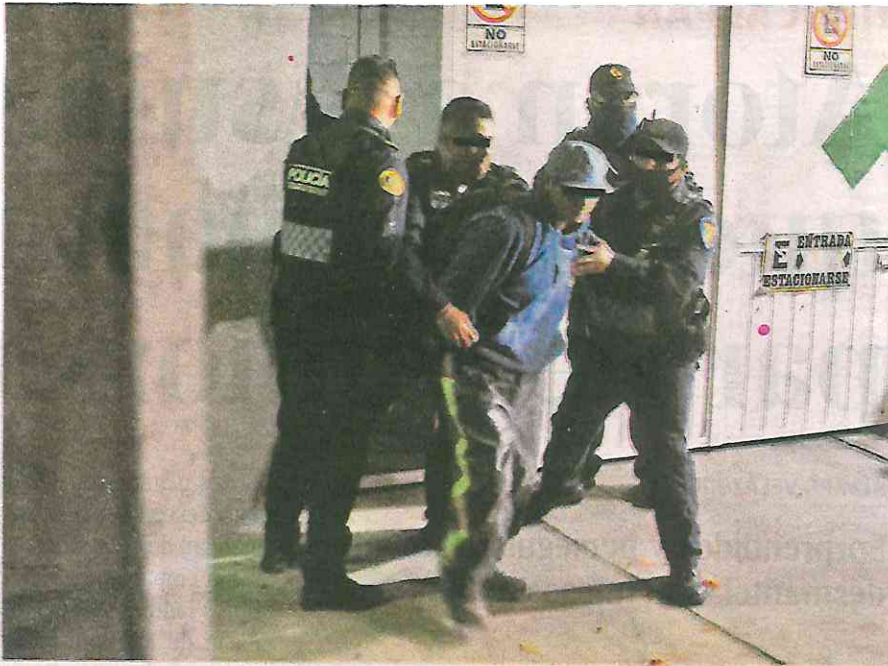
Los invasores fueron sacados y detenidos por elementos policíacos