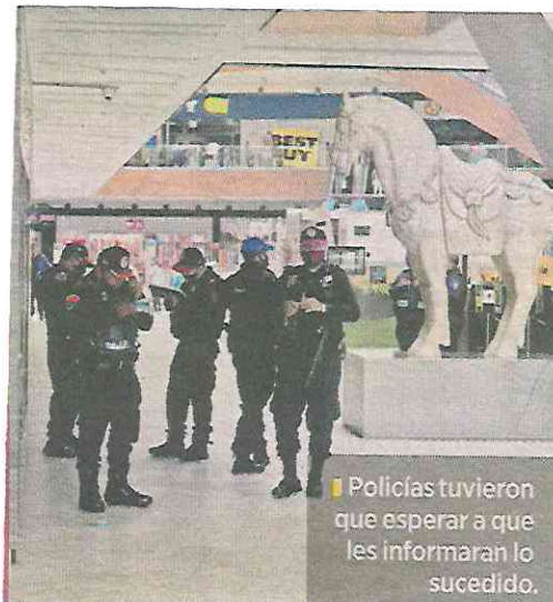
Policías tuvieron que esperar a que les informaran lo sucedido.