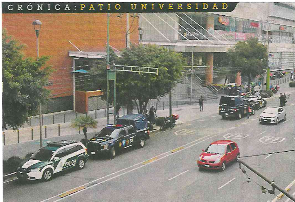
■ Tras la activación de la alarma, se dio una movilización policiaca entorno a la plaza comercial.