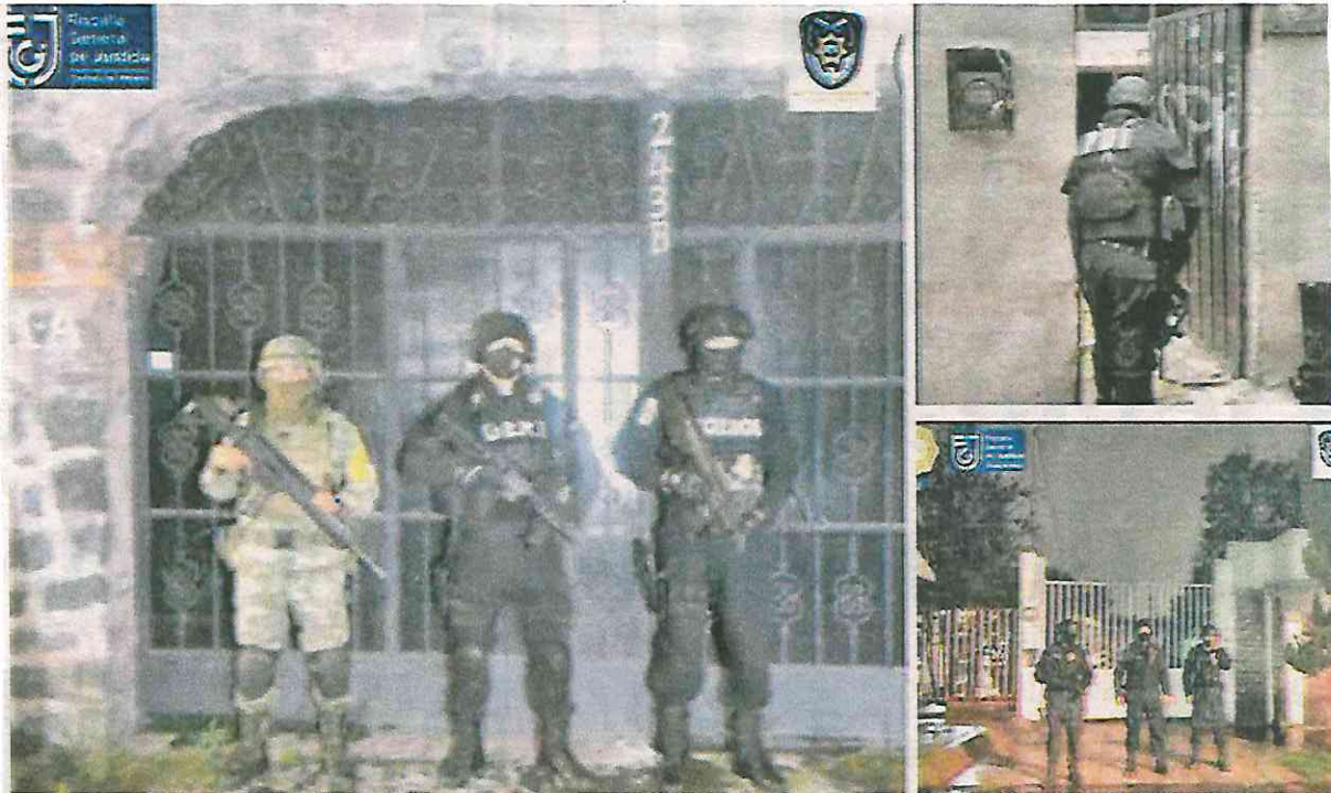
En las acciones contra el narcotráfico en la CDMX participaron decenas de agentes de la PDI, FGJ, SSC y de la Guardia Nacional