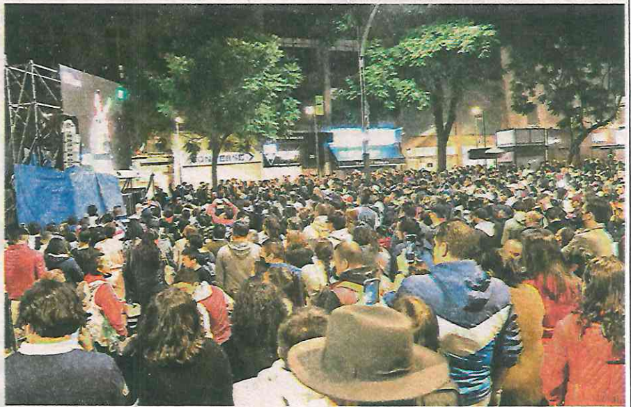
Se rompió récord en asistencias donde estiman 280 mil personas

“Realmente fueron cuestiones muy menores, fueron algunas asistencias médicas, pero más por lo lleno que estaba el Zócalo que algunas personas se sintieron mal y algunos conatos con la policía porque en algunos lugares pues se puso un filtro para que ya no pasara gente porque ya estaba muy lleno el Zócalo por cuestiones de protección civil, pero realmente fueron menores respecto a la cantidad de personas que asistieron”.