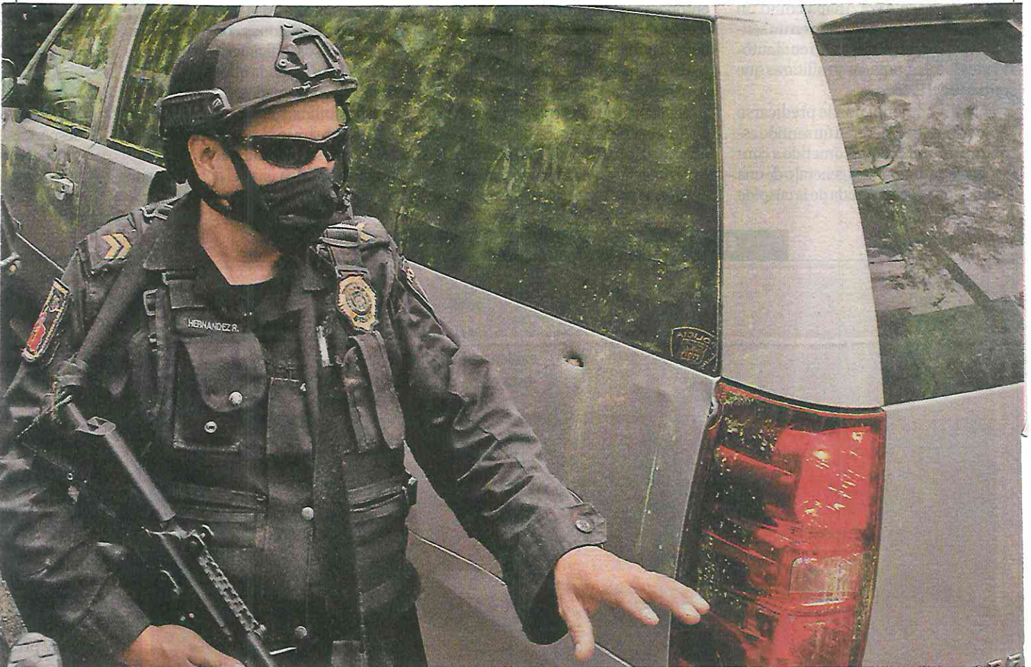
La organización falló en su intento de asesinar al titular de Seguridad de CdMx, Omar García Harfuch, en 2020.