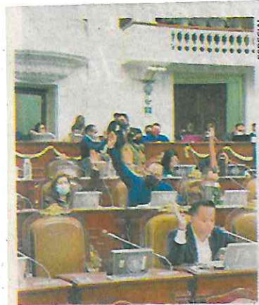
En el Congreso, el punto de acuerdo fue aprobado por unanimidad.

EL UNIVERSAL publicó este domingo que la Secretaría de Seguridad Ciudadana capitalina detectó que los montaviajes utilizan las bases de datos de los bancos para llegar a sus víctimas, por lo que las autoridades mantienen activos los patrullajes cibernéticos. ●