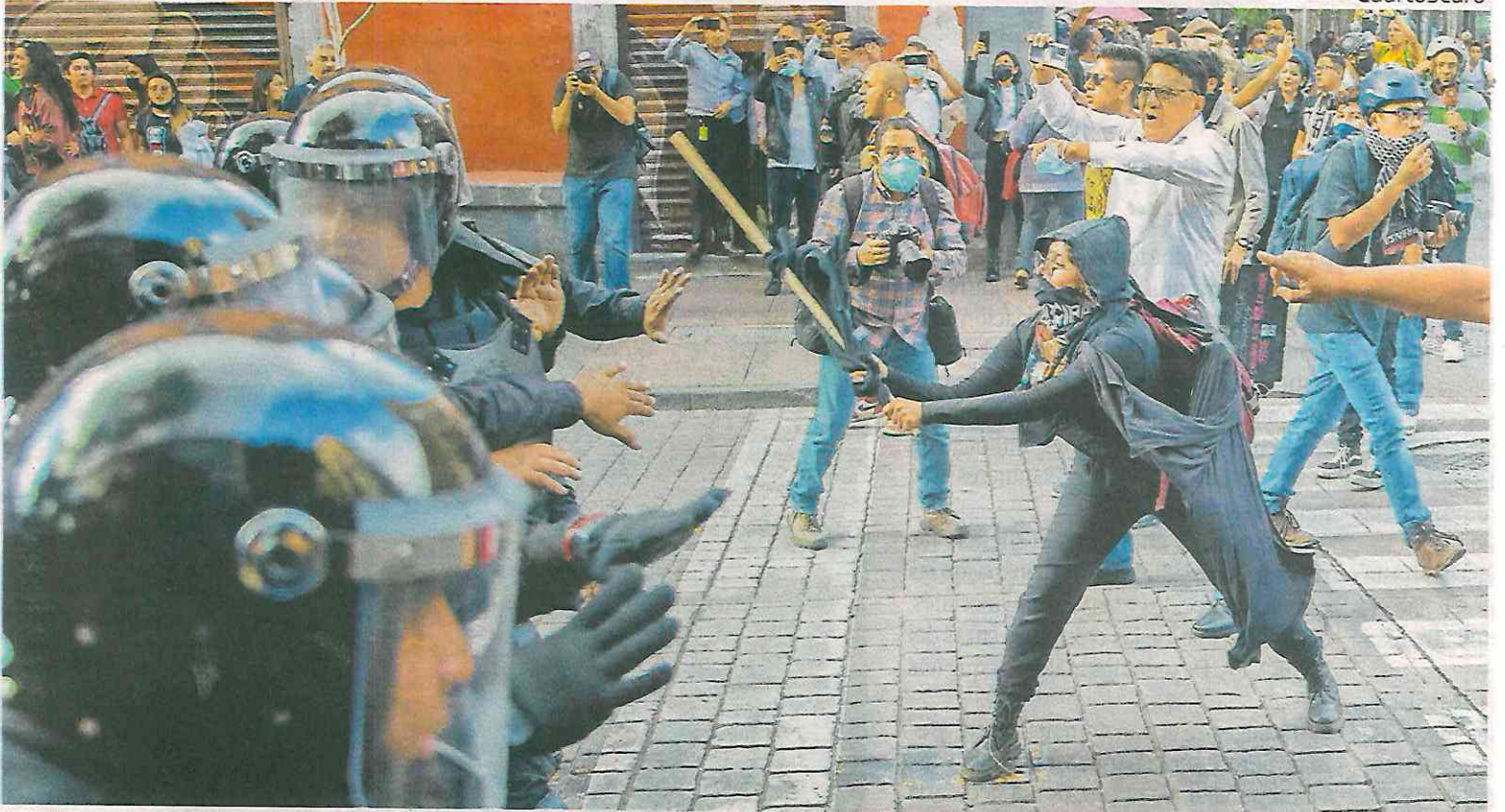
Estalló la violencia de los embozados contra los policías.