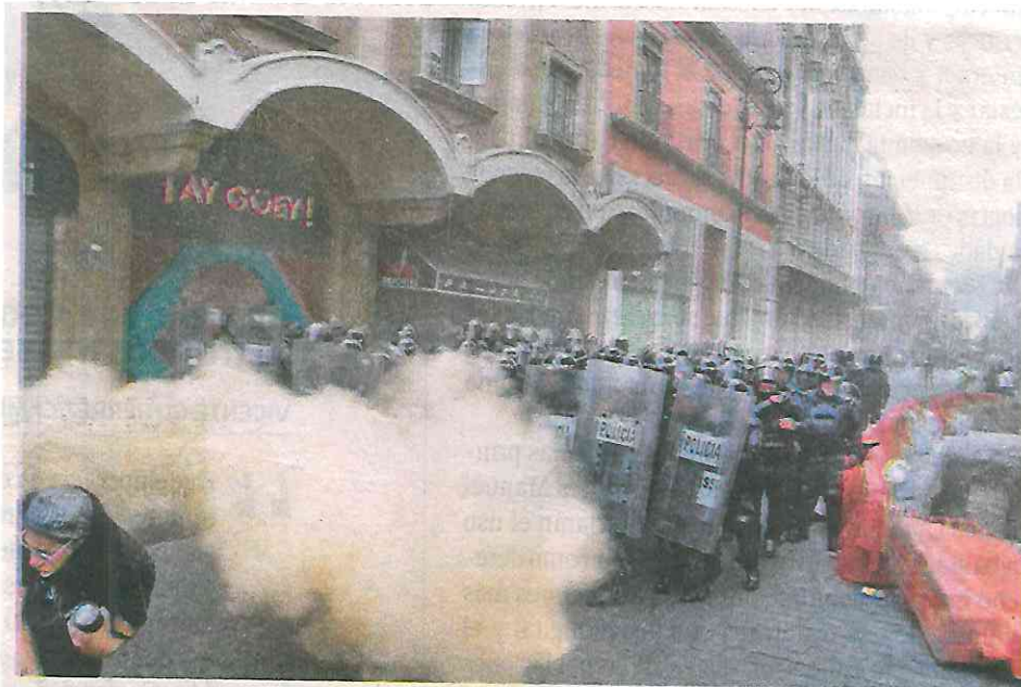
Los encapuchados se enfrentaron con policías de la SSC de la CDMX en la esquina de 5 de Mayo y Palma

de los normalistas de Ayotzinapa, al cumplirse ocho años de su desaparición.