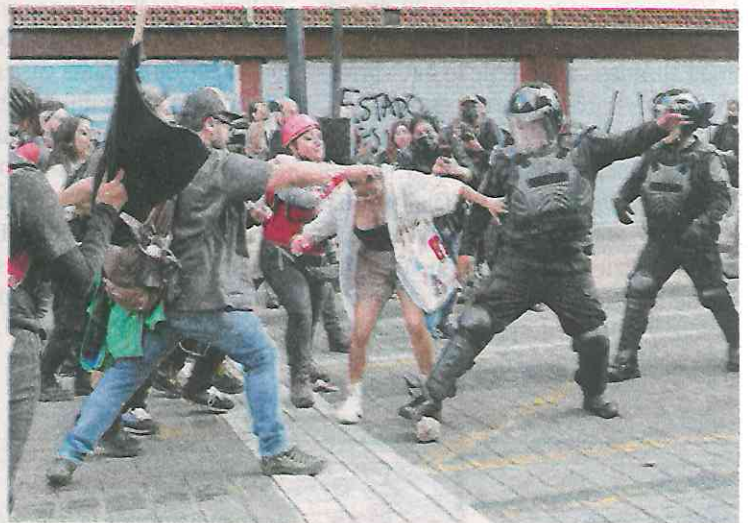
Policías se enfrentaron con un grupo durante la marcha

Advirtieron al gobierno de Andrés Manuel López Obrador que “seguirán en pie hasta saber la verdad” y pidieron respuestas contundentes. “Va que científicamente, no tenemos pruebas de que los jóvenes están muertos... No hay indicio de vida, pero tampoco hay indicio de muerte”.