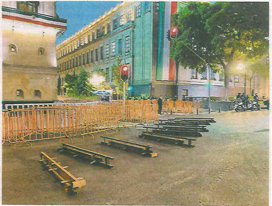
Desde temprano instalaron vallas en Palacio Nacional.

Pasadas las 16:00 horas de este lunes, inició la marcha convocada desde la semana pasada por familiares, amigos y estudiantes de la misma escuela normal guerrerense que salió desde el Ángel de la Independencia rumbo al Zócalo capitalino,