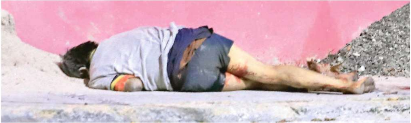
El hombre se tambaleaba de un lado a otro mientras caminaba por la calle hasta que cayó desmayado sobre el montículo de arena