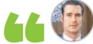
MIGUEL TORRUCO DIPUTADO FEDERAL

“Debemos hacer patria y recuperar las alcaldías que en su momento perdimos y se las apoderó la derecha. Tenemos un enorme reto”