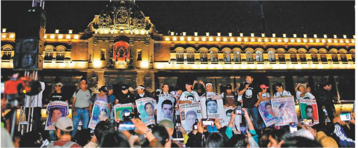
Unos 5 mil manifestantes marcharon del Ángel al Zócalo para demandar justicia en el noveno aniversario de la matanza de los 43 normalistas.

David Razú "El gasto en pensiones para 2024 salda deuda de hace 25 años" - P. 19