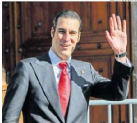
Miguel Torruco aspira ser el candidato de Morena.