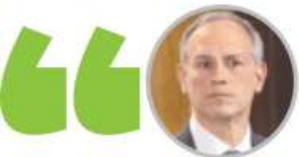
HUGO LÓPEZ-GATELL EXSUBSECRETARIO DE SALUD

“Será el pueblo de la ciudad quien decida quién es la persona que puede ofrecer la capacidad para resolver los problemas del día a día”