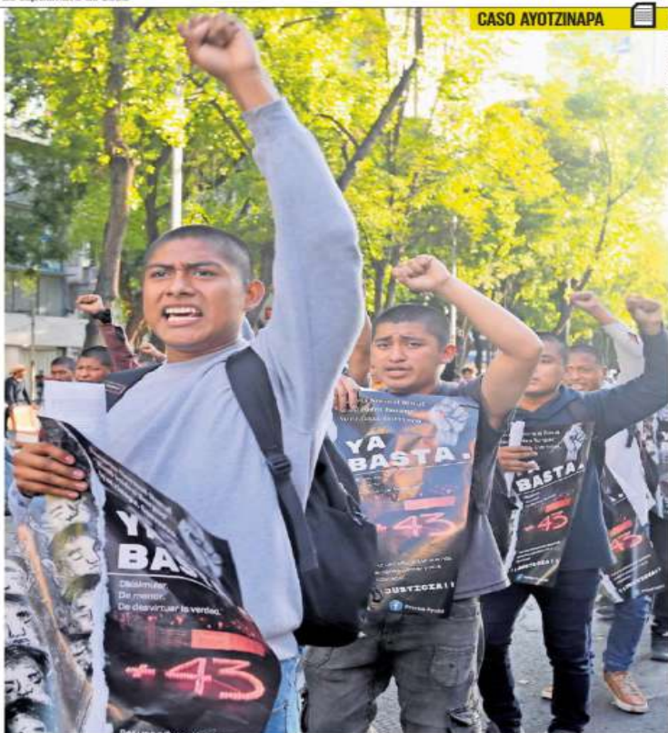
Pancartas y consignas acompañaron la marcha por el noveno aniversario de la desaparición de los estudiantes.

¿Qué prohíbe la ley? Contratar con recursos públicos seguros de gastos médicos privados, de vida o de pensiones.