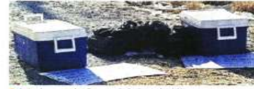
A lo largo de 6 municipios de NL, los delincuentes fueron dejando los restos de cuerpos mutilados.

MONTERREY. En uno de los hechos más cruentos cometidos por un cártel en Nuevo León, un reguero de cuerpos mutilados de al menos 12 personas fue dejado ayer en siete puntos a lo largo de seis municipios metropolitanos.