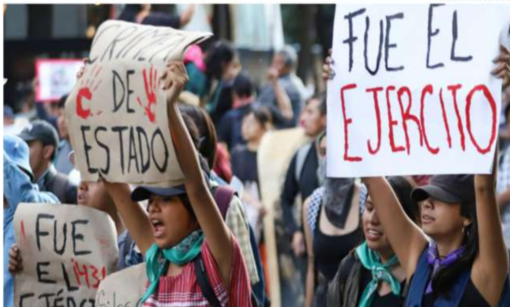
Más de 6 mil personas participaron en la protesta.

Al llegar al Antimonumento, con las fotos de los estudiantes desaparecidos, padres y madres de los 43 desaparecidos pasaron lista a los jóvenes cuyo paradero aún se desconoce. Cerca de las 18:00, horas la vanguardia del contingente llegó a la Plaza de la Constitución donde se instaló el templete desde el cual los padres de los 43 dieron un mensaje; al mismo tiempo, personas con el rostro cubierto rayaron las va-