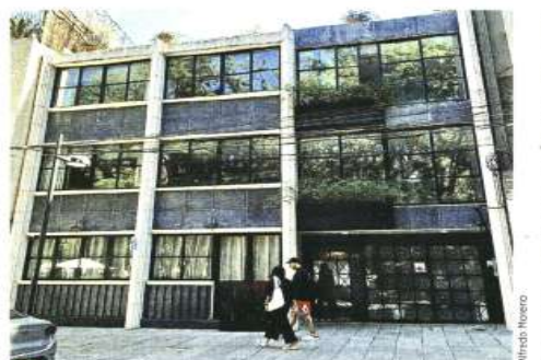
En el lugar, opera ya el Hotel Casa Miravalle, cuyas habitaciones se ofrecen a través de la plataforma Airbnb.