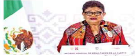
Antes del 17 de octubre, el Consejo Judicial debe emitir su opinión sobre si Godoy debe continuar al frente de la Fiscalía.