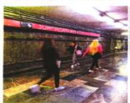
El segundo tramo a intervenir va de Balderas a Observatorio.

El jefe de Gobierno, Martí Batres, informó que en menos de un mes se estima la reapertura del tramo. ●