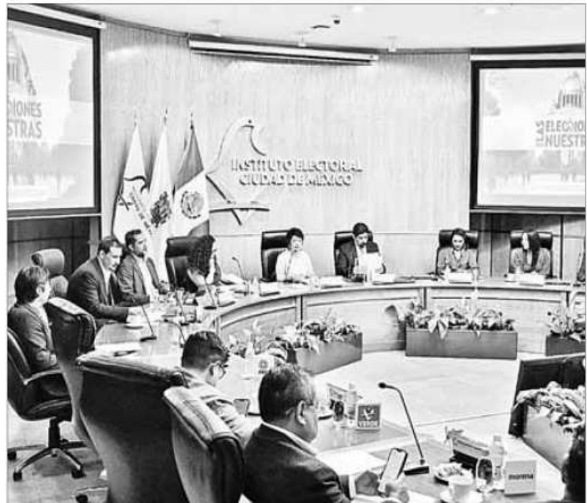
▲ El Instituto Electoral de la Ciudad de México estableció un monto de 6 millones 51 mil 900.96 pesos como tope de gastos de precampaña para los

Dichas actividades se realizarán en el periodo indicado, de lo contrario serán considerados actos anticipados de precampaña, lo que implica hacerse acreedor a una sanción.