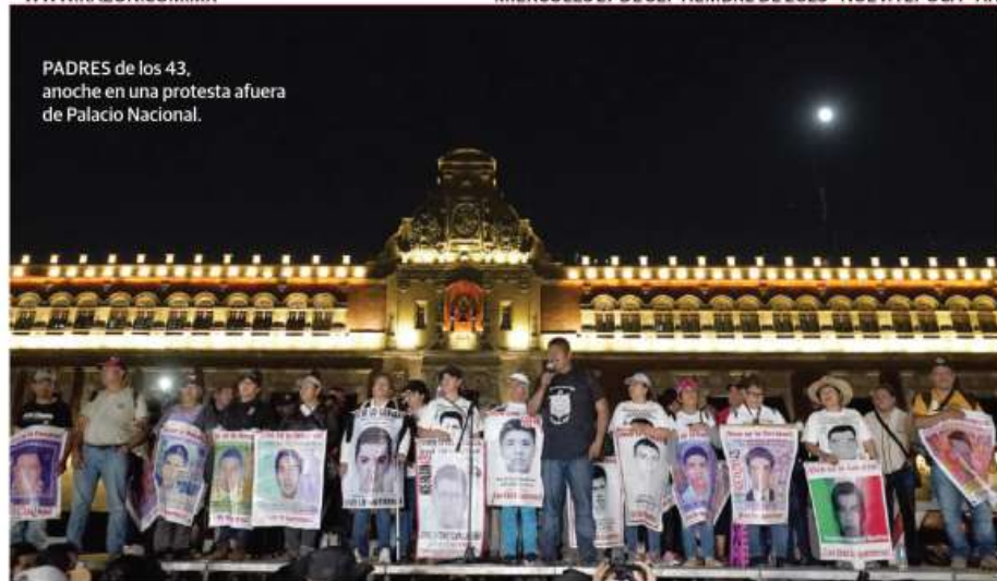
PADRES de los 43, anoche en una protesta afuera de Palacio Nacional.

9° aniversario del caso Iguala entre posturas confrontadas de 4T y familiares de los 43