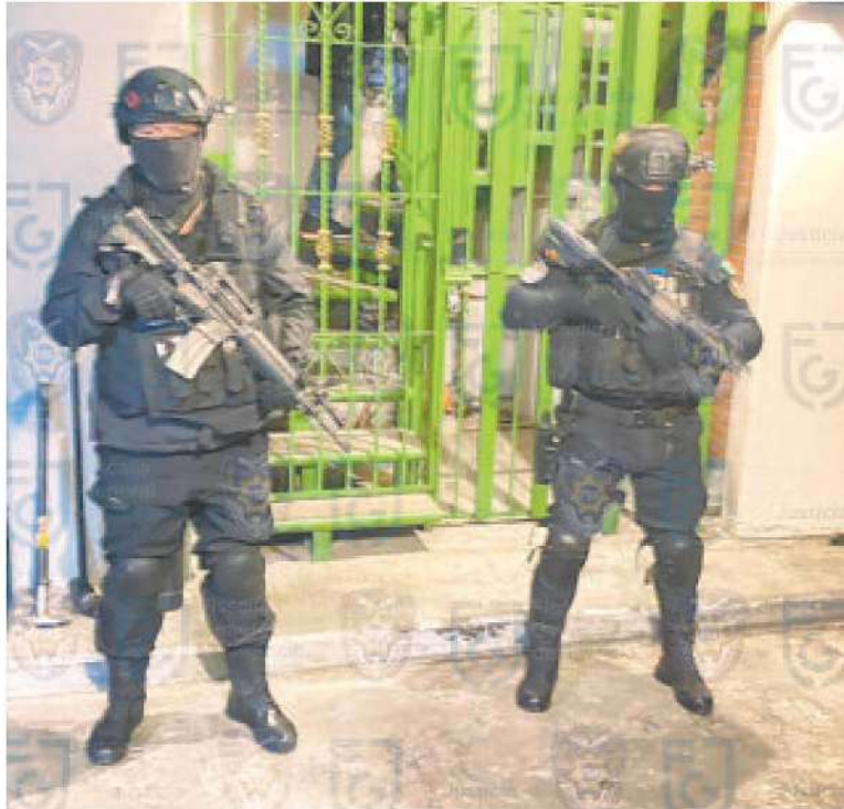
La Fiscalía cateó la vivienda donde hallaron el cuerpo de Monserrat