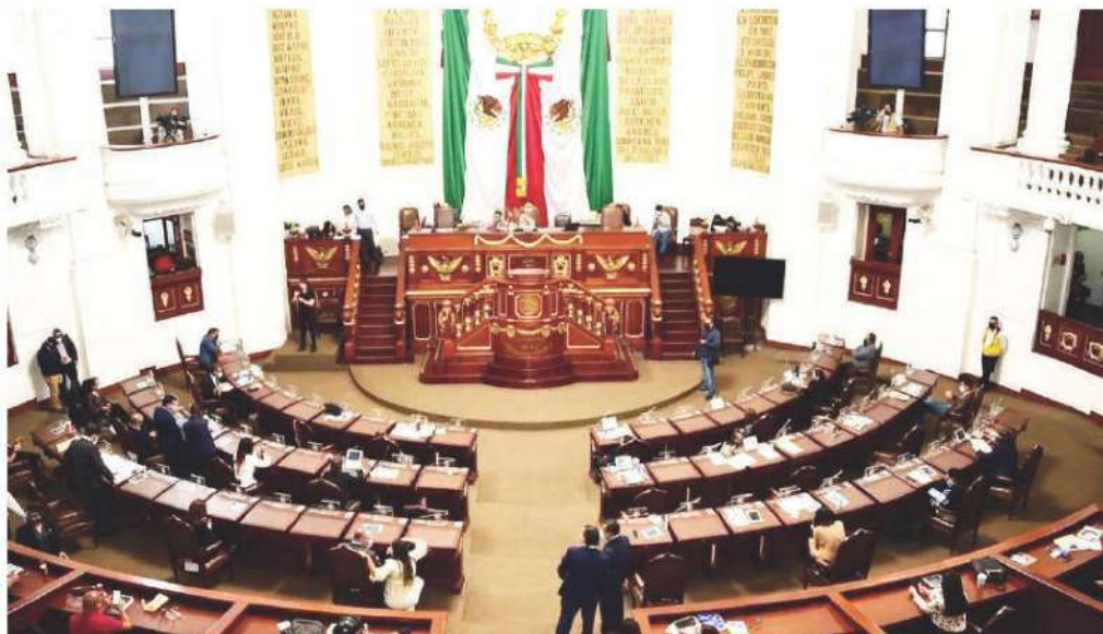
El calendario asegura que todas las áreas de gobierno rindan cuentas. Especial