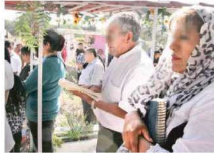
Con aplausos de todos los presentes finalizó el sepelio

Un altercado entre los familiares de la extinta joven marcó su entierro, ya que unos pedían esperar a los padres y otros que se inhu- mara sin ellos, optan- do por esto último