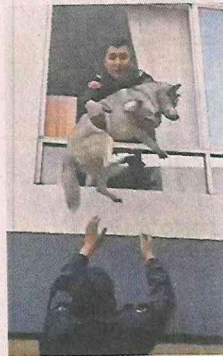
Los uniformados lograron salvar ileso al can el sábado.