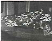
El arma rotulada del homicida.