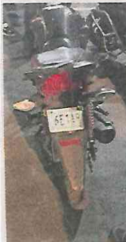
El responsable huía en moto.