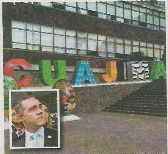
Desenmascararon al alcalde

De acuerdo con los denunciantes, los robos a negocios, los