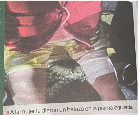
■ A la mujer le dieron un balazo en la pierna izquierda.