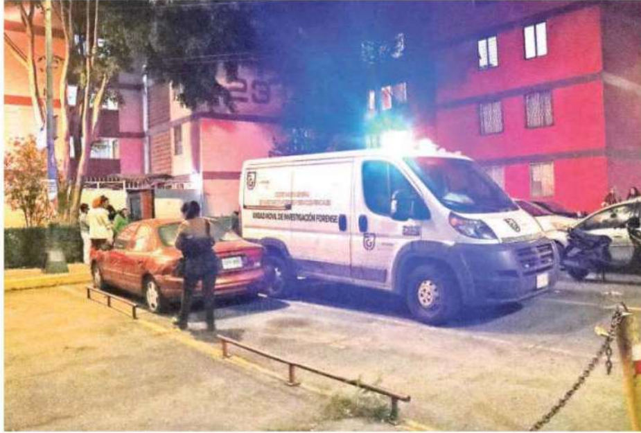
El triple deceso ocurrió la noche del sábado en un departamento de la Unidad Habitacional Ferrocarrilera