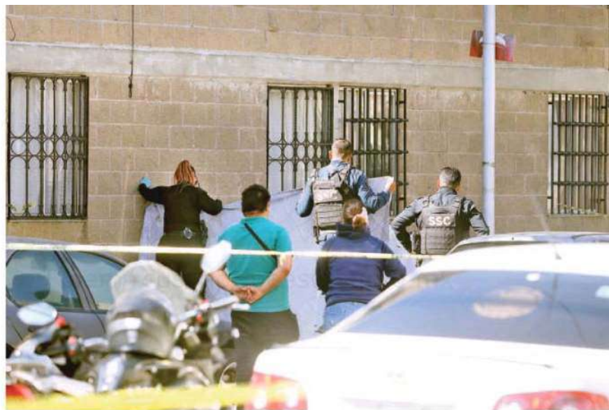
Transeúntes de inmediato solicitaron la intervención de personal de los cuerpos de socorro y de la policía