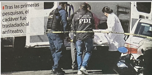
Tras las primeras pesquisas, el cadáver fue trasladado al anfiteatro.