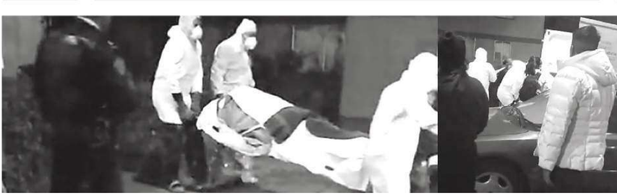
Los cadáveres fueron rescatados y trasladados al Semefo