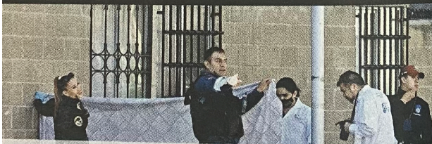
Personal de la Fiscalía capitalina se presentó para llevar a cabo los peritajes.

Los uniformados presumen que la mujer se vino abajo desde una altura aproximada de 15 metros, a través de una ventana que da hacia la calle.