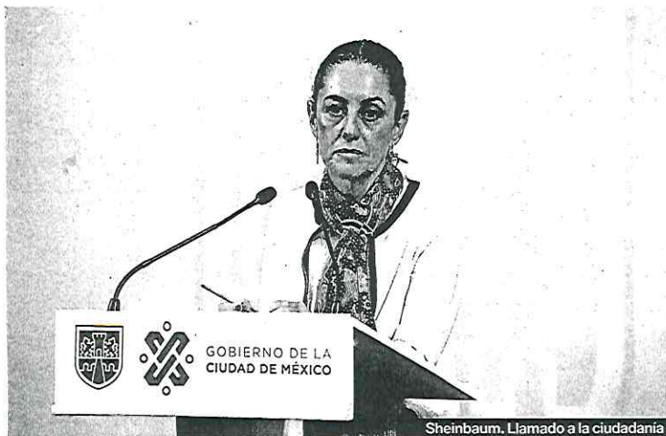
Sheinbaum. Llamado a la ciudadanía

La madrugada del sábado 12, personal de la alcaldía Miguel Hidalgo y efectivos de la Secretaría de Seguridad Ciudadana (SCC) abrieron sin aviso la puerta de una bodega ubicada en el número 810 de la avenida Paseo de las Palmas, en la exclusiva colonia Lomas de Chapultepec. ▶