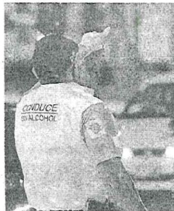
Mil 256 vehículos han sido remitidos al corralón.

El alcoholímetro decembrino continuará hasta el próximo 16 de enero, cada jornada se instalan entre 25 y 30 puntos de revisión móviles. De acuerdo con las autoridades, el éxito del programa se basa en su carácter preventivo y gracias a él se han logrado reducir considerablemente los accidentes automovilísticos provocados por el alcohol. •