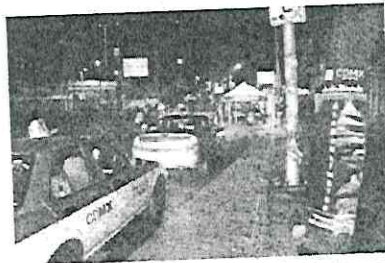
Este operativo estará funcionando hasta el 16 de enero.

MIL 268 PERSONAS fueron detenidas y más de 250 vehículos fueron revisados al conducir así lo informó el jefe de la Secretaría de Seguridad Ciudadana (SSC) de la Ciudad de México. Señaló que, desde el 8 de diciembre y hasta este 26 de diciembre se operará el operativo "Torito" con 300 unidades Alcostop, 230 de 400 unidades Alcostop (ambos tipos) y 141 unidades de Alcostop de alta capacidad. Por medio de "Torito" se busca reducir el consumo de alcohol en el tránsito y la seguridad vial en los días de fiesta, incluidos los cantantes y solistas de cantantes de la Ciudad de México. Este operativo estará funcionando hasta el 16 de enero, con 805 elementos y 123 vehículos en 23 puntos de revisión. Por medio de 7 puntos con jornadas diurnas y 16 puntos para las jornadas nocturnas se realiza el "alcoholímetro". Los equipos "Alcostop" miden en el ambiente los niveles de alcohol, permitiendo la distancia entre conductor y los oficiales.