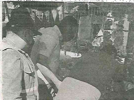
Protegen a la población en Tlalpan