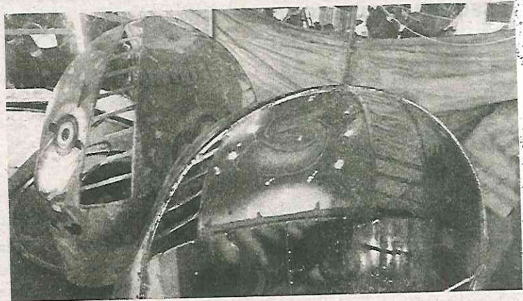
Por poco y se produce una tragedia

El dueño del juego mecánico, de 36 años de edad, fue detenido y puesto a disposición del agente del Ministerio Público, quien determinará su situación jurídica