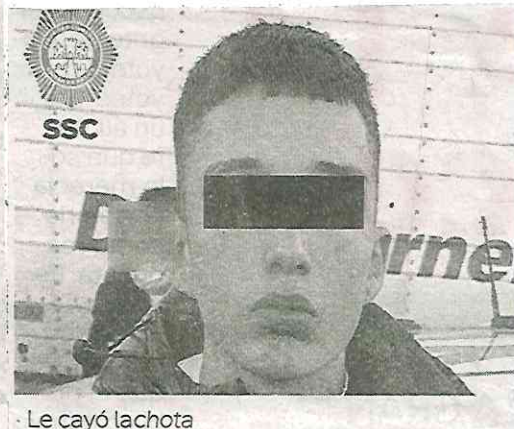
Le cayó lachota

El presunto criminal fue presentado junto con el arma y la motocicleta, que cuenta con reporte de robo en el año 2019, ante el agente del Ministerio Público que determinará su situación jurídica por los delitos de homicidio y lesiones.