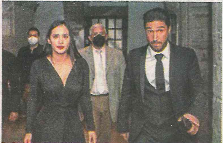
El inculpado y la alcaldesa en Cuauhtémoc

El empresario fue encarcelado en el Reclusorio Oriente