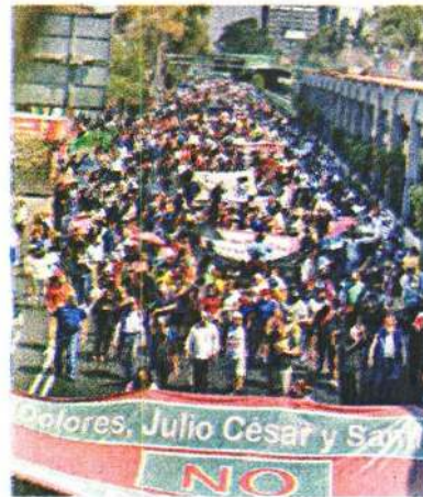
Participaron mil 300 militantes y simpatizantes de Morena.