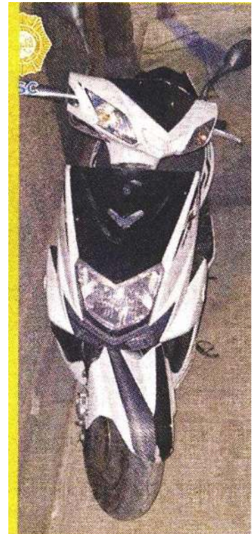
■ En una motoneta hacían los repartos a domicilio.

Los cuatro hombres fueron presentados ante un agente del Ministerio Público de la Fiscalía Central de Investigación en la Colonia Doctores.