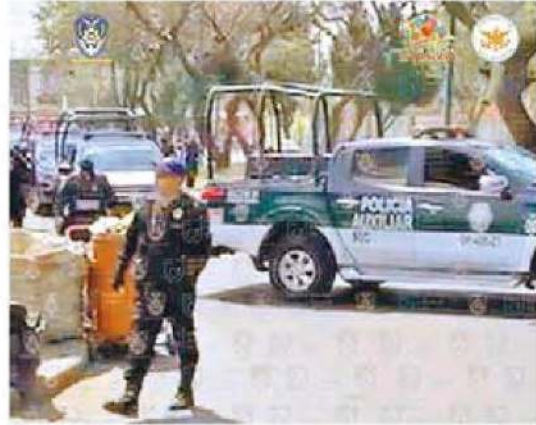
Gracias a una denuncia se logró el cateo en el inmueble, de donde fueron rescatados los dos menores