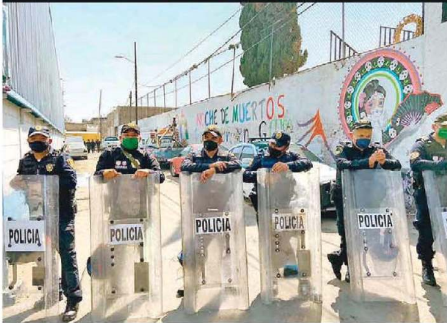
La Guardia Nacional, SSC y Fiscalía, en conjunto tras el robo por recepción