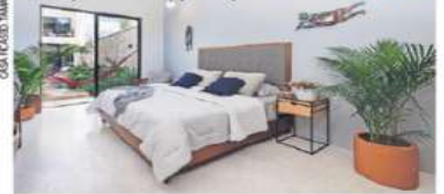
CASA REAZO THAMBA LIMBA INZUELLA

El arte de optimizar los espacios pequeños | GAB |