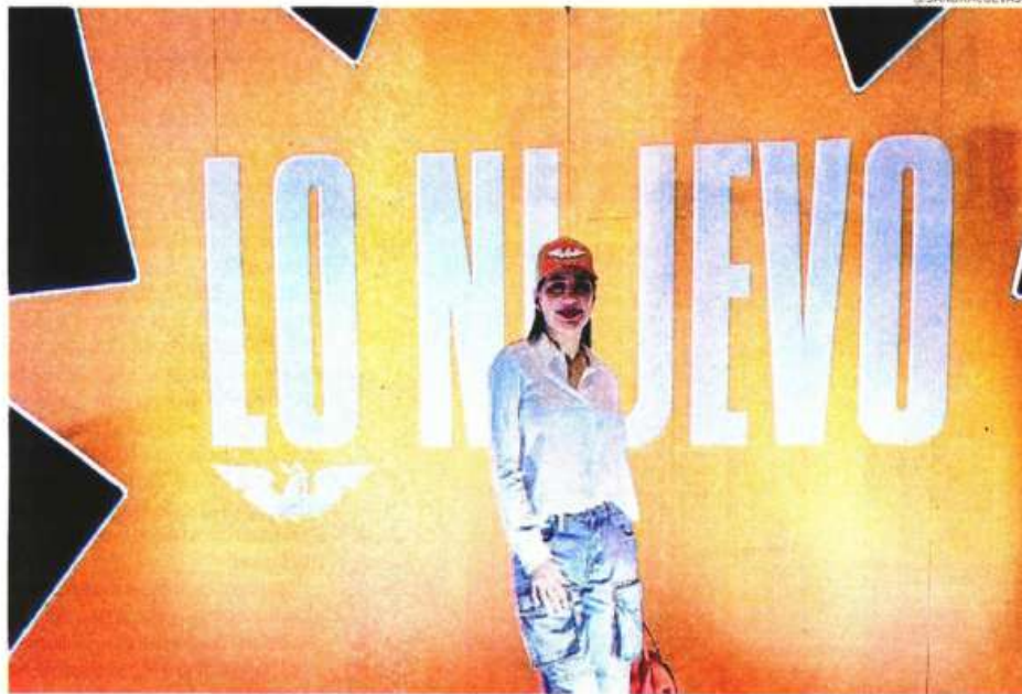
La alcaldesa de Cuauhtémoc, Sandra Cuevas irá por una senaduría de MC.