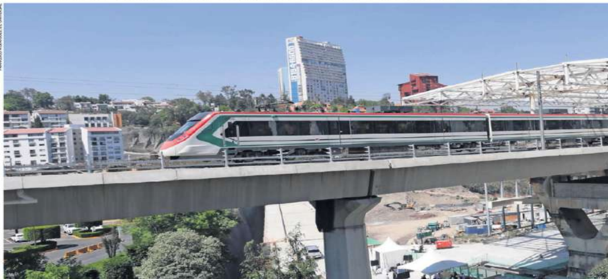
El presidente Andrés Manuel López Obrador anunció que en agosto inaugurará todo el Tren Interurbano México-Toluca, hasta la terminal Observatorio. El Mandatario realizó un recorrido de supervisión de las obras acompañado por la gobernadora del EDOMEX, Delfina Gómez.

Escanear el código para visitar esta sección en nuestro sitio web