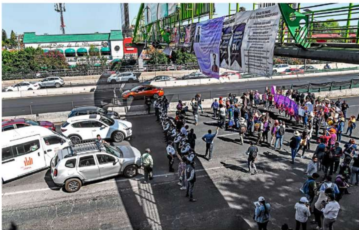
SIN JUSTICIA. La sentencia absolutoria que dictó un juez mexicano a un hombre acusado de violar a una menor de 4 años provocó indignación en un grupo de ciudadanos que bloquearon por más de 5 horas Periférico Norte PÁGINA 2

TEXAS ARREMETE CONTRA REFUGIO DE MIGRANTES EN EL PASO MUNDO P.14