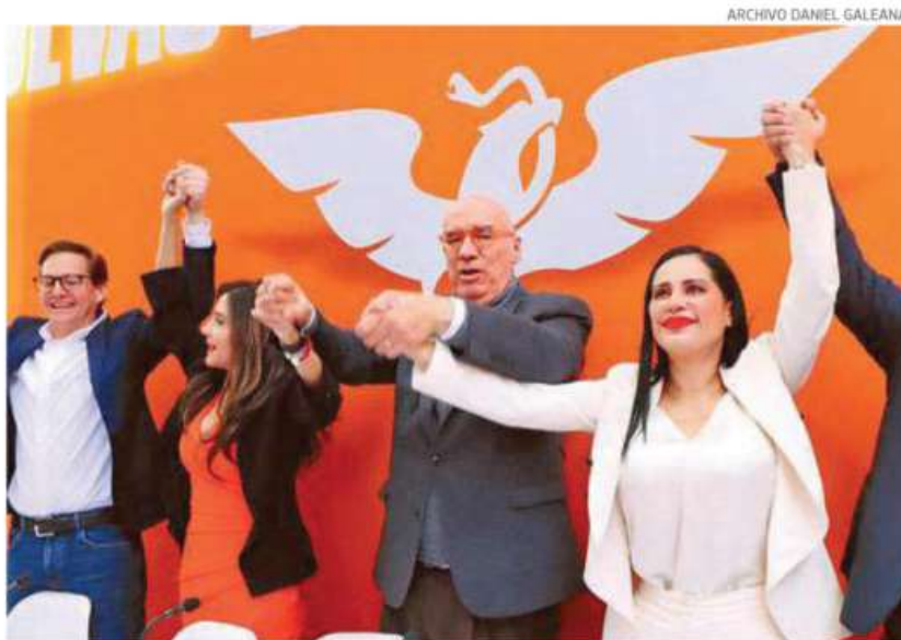
Sandra Cuevas dejó la Cuauhtémoc para buscar el Senado por Movimiento Ciudadano

Ayer, durante la sesión del pleno, la licencia que solicitó Sandra Cuevas propició críticas de diputados locales, tal es el caso de la legisladora priísta Maxta González, quien consideró que Cuevas hizo un mal trabajo al frente de la demarcación.