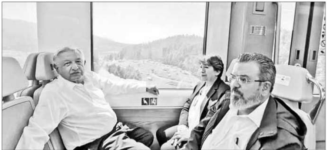
► El presidente Andrés Manuel López Obrador anunció que las obras del Tren Interurbano México-Toluca concluirán en agosto. En esta imagen, con la gobernadora mexicana, Delfina Gómez.

El secretario de Infraestructura, Comunicaciones y Transportes, Jorge Nuño, mencionó que ya comenzó la etapa de pruebas en la ruta del bitúnel, entre el estado y la Ciudad de México, hasta llegar a Santa Fe, cuya obra civil concluyó a principios de año.