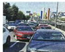
El colapso vial se extendió por cinco horas.