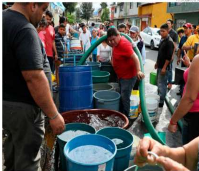
Luego de cinco sesiones suspendidas por falta de quórum, este martes 34 diputados decidieron asistir al recinto de Donceles.

Varias semanas atrás, Morena había amenazado con negarse a aprobar cualquier iniciativa que contuviera las palabras "día cero", pues en su dicho solamente se trataba de una estrategia des-