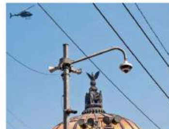
REPROGRAMACIÓN. En la capital no se activarán las alertas sísmicas como parte del ejercicio de preparación ante un temblor, informó la SGIRPC.

Durante esa conferencia informaron que en la alcaldía Tlalpan encontraron una toma clandestina, donde diversas pipas hacían una distribución ilegal y venta del agua; sin embargo, no presentaron una iniciativa para imponer penas a quienes cometieran estos robos.