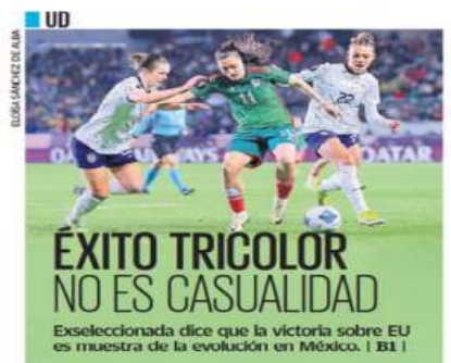
UD ELIAS SANCHEZ DE ALBA

Al grito de "el Estado le ha fallado a nuestra niña, nosotras no le vamos a fallar", un centenar de activistas cerraron la circulación en protesta por la decisión de un juez que absolvió a un presunto abusador sexual de una menor de cuatro años. Tras cinco horas, el bloqueo finalizó. | A19 |