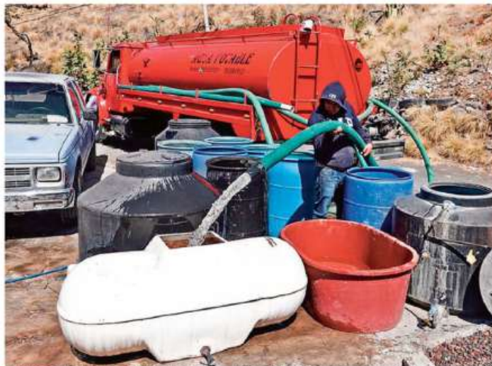
MÉTODO. El Gobierno capitalino detectó que a través de pipas, las personas sustraen de manera ilegal el líquido y lo venden en colonias donde escasea.

Aunado al pago con prisión, la legisladora plantea multas de de mil 085 a 32 mil 571