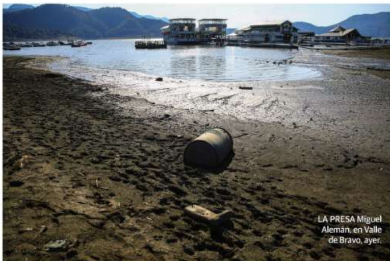
LA PRESA Miguel Alemán, en Valle de Bravo, ayer.

EN LA CDMX la 4T bloquea declaración de emergencia por crisis hídrica; antes ya había reventado 6 sesiones. págs. 12 y 15