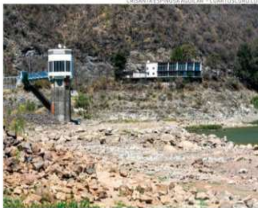
Así está la presa Miguel Alemán en Valle de Bravo, del Cutzamala.