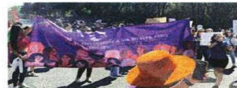
Ayer, poco después de las 15:00 horas, familiares y colectivos se movilizaron en Periférico Norte.

Con ello, Morena, el Partido del Trabajo, Verde Ecologista, Movimiento Ciudadano y la alianza PAN-PRD dieron su visto bueno a la organización.