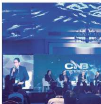
ANÁLISIS. En el Congreso Nacional del Blindaje los expositores hablaron sobre los desafíos de esa industria.