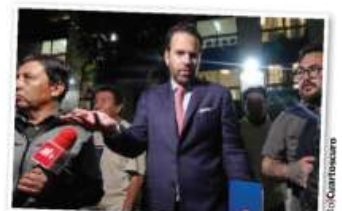
EL PERIODISTA Carlos Loret, anoche al salir de la audiencia.

No me van a doblar: Loret en audiencia por acusación de Pío