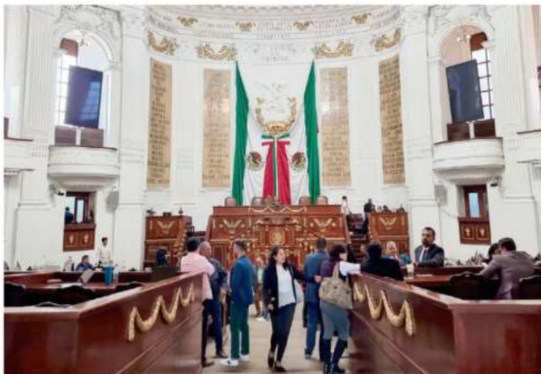
LA SESIÓN del Congreso de ayer, durante la cual por fin se discutió el tema de la crisis del agua.

EL PLENO rechaza proyecto de punto de acuerdo presentado por Movimiento Ciudadano, con 23 votos en contra y 16 a favor; panistas habían anunciado que recurrirían al Poder Judicial para obligar al Legislativo a debatir el asunto