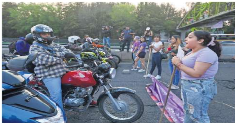
Integrantes del colectivo Hermanas Aliadas mantuvieron cerrado Periférico Norte por cinco horas, tras el caso de abuso a una niña.

El Poder Judicial señaló que de cuatro análisis periciales en materia de psicología, se advierte que únicamente el primero hace referencia a indicadores psicológicos de víctimas de la violencia sexual. ●