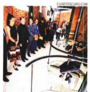
Autoridades inauguraron en Milpa Alta una estación.

La obra, que fue realizada con 75 toneladas de estructura metálica y 23 toneladas de refuerzo, cuenta con cuartos, sanitarios y regaderas divididos para hombres y mujeres, así como con un cuarto de lactancia.