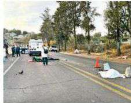
El hombre 83 años y esposo de la hoy occisa fue llevado a un hospital

A el lugar donde yacía el cuerpo sin vida de la mujer de edad avanzada, el cadáver del biker y la moto destrozada llegó personal de Investigación Forense y Servicios Periciales quienes tras concluir las diligencias trasladaron los cuerpos hasta la coordinación territorial correspondiente