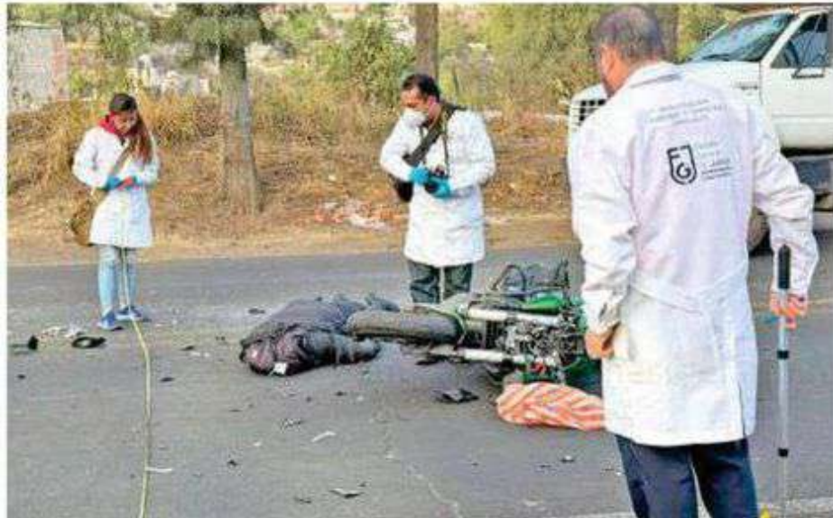
El biker no pudo detenerse a tiempo por lo que trató de esquivar a los abuelitos, pero falló