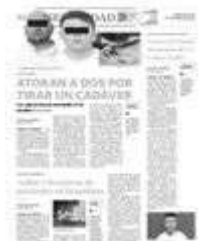
Se acabó su minita de oro