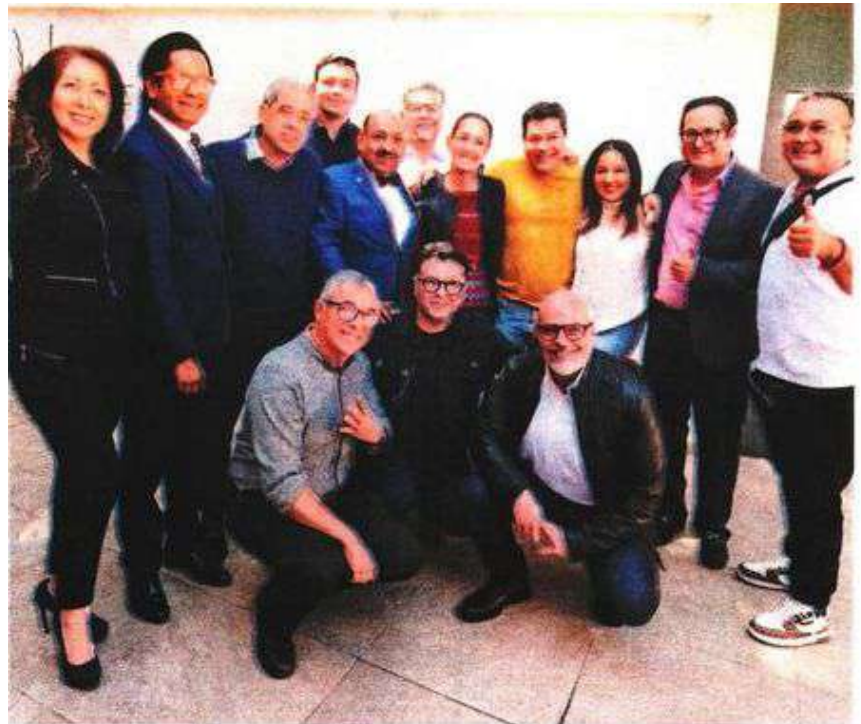
Claudia Sheinbaum habló con algunos youtubers.

Expresa que habrá continuidad de los proyectos de la 4T, pero su gobierno tendrá sello propio