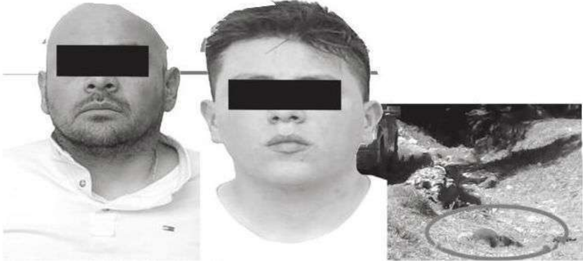
Le quisieron jugar al mago, pero no les salió