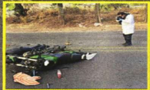
La motocicleta Dominar es la misma que presumía en sus redes el agente.

El lesionado, de 83 años y esposo de la víctima, fue trasladado al hospital en donde lo reportan grave.