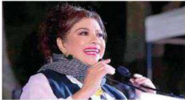
· Enfatizó los logros de Claudia Sheinbaum

· “Sueño con que el Metro de esta ciudad sea en seis años uno de los mejores del mundo”