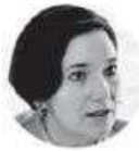
MARCELA FIGUEROA Subsecretaria de Desarrollo Institucional de la SSC

"Los delitos contra las mujeres se han reducido, y lo que vemos es que las mujeres están confiando más en las autoridades para pedir ayuda", enfatizó la subsecretaria de Desarrollo Institucional.