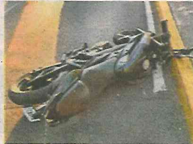
A su unidad, una Bajaj Pulsar, se le desprendió el manubrio.

Personas que vieron al hombre tirado se alarmaron al ver que el pi-