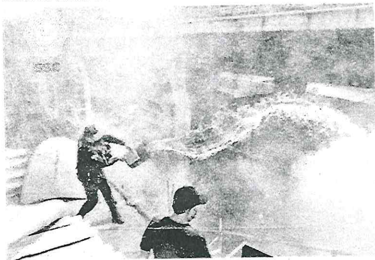
Con cubetas, policías y habitantes de la zona trataron de apagar las llamas