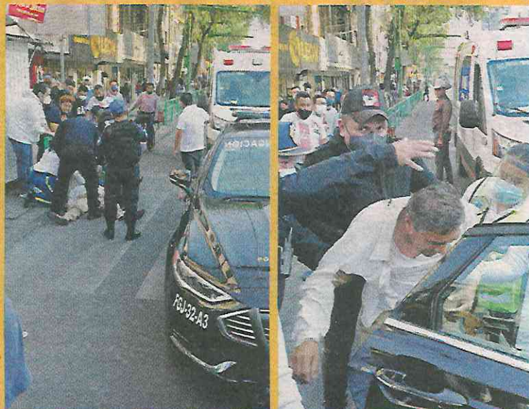
■ Por un mandato judicial, el hombre fue arrestado en el Centro Histórico.