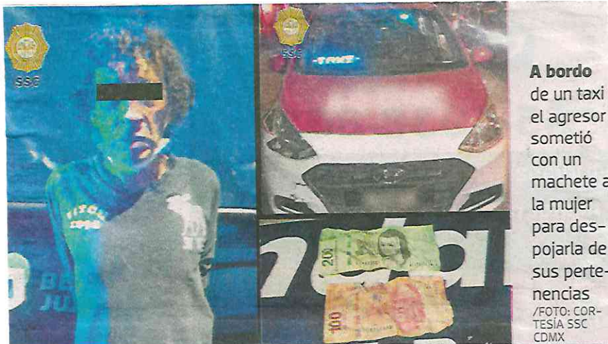
A bordo de un taxi el agresor sometió con un machete a la mujer para despojarla de sus pertenencias

Por tal motivo, al hombre que fue detenido le fueron leídos sus derechos de ley y posteriormente fue puesto a disposición junto con el machete y el vehículo asegurado, ante el agente del Ministerio Público correspondiente, quien determinará su situación jurídica.