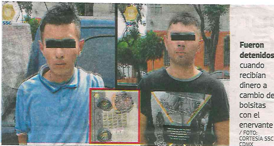
Fueron detenidos cuando recibían dinero a cambio de bolsitas con el enervante

encargado de determinar su situación jurídica y de dar inicio a la carpeta de investigación del caso.