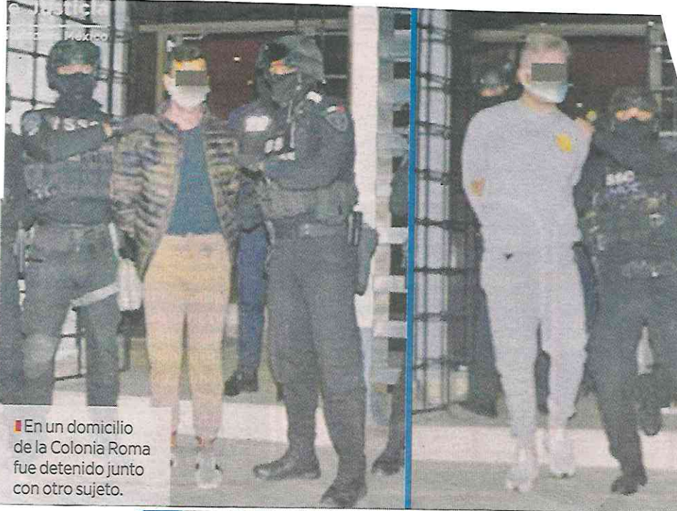
■ En un domicilio de la Colonia Roma fue detenido junto con otro sujeto.

Especial y ROSTRO CUBIERTO POR LA AUTORIDAD