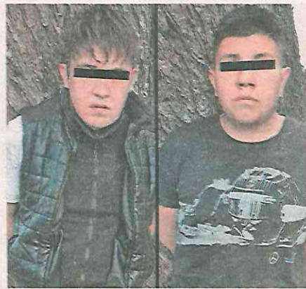
Ambos tenían la consigna de distribuir narcóticos en Calzada Tláhuac Chalco

Durante las investigaciones de la Secretaría de Seguridad Ciudadana de la CDMX, se logró conocer que los deteni-