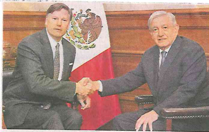
■ Christopher Landau abordó en una mesa redonda temas relacionados con políticas del Presidente López Obrador.

y su eventual liberación un mes después tras un acuerdo con México.