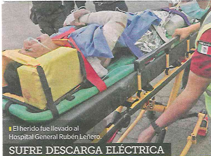
El herido fue llevado al Hospital General Rubén Leñero.