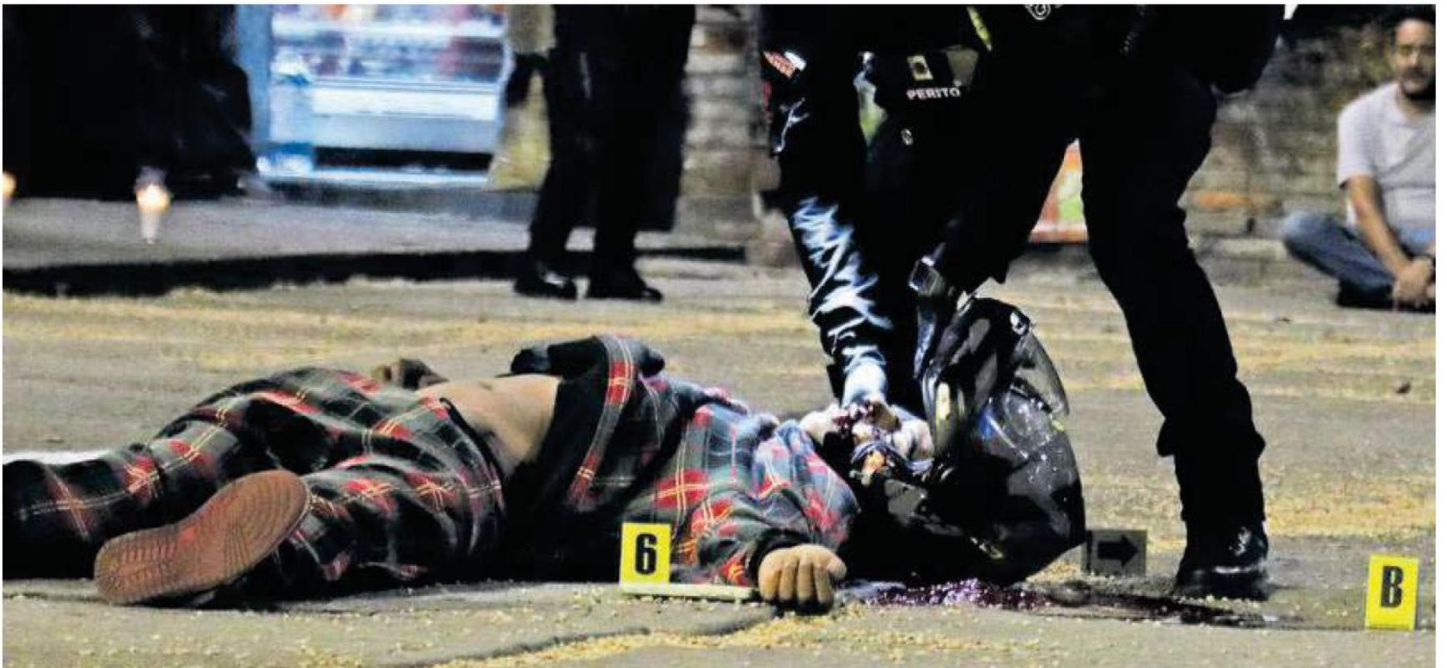
Un joven motociclista murió en presunta venganza luego de recibir cinco balazos en calles de la colonia CTM Culhuacán, Sección VII, en la alcaldía Coyoacán

Hasta el lugar se dio una intensa movilización de elementos de la Secretaría de Seguridad Ciudadana, quienes hallaron al sujeto tirado aún con su casco puesto; había también casquillos