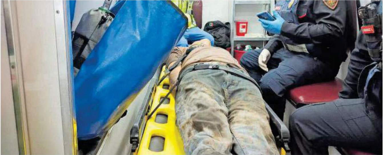
Hombre es rescatado por elementos de la Secretaría de Seguridad Ciudadana y personal de Protección Civil tras descender a las vías