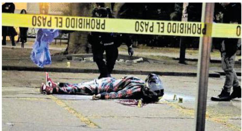
Su atacante corrió detrás de él mientras le disparaba una y otra vez