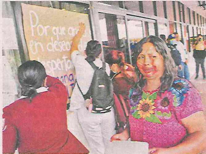
■ Cerca de 50 alumnos del IPN se sumaron a la exigencia para que autoridades refuercen la búsqueda de la joven.