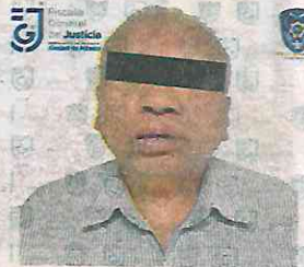
Presuntamente atacó a un hombre con un arma blanca