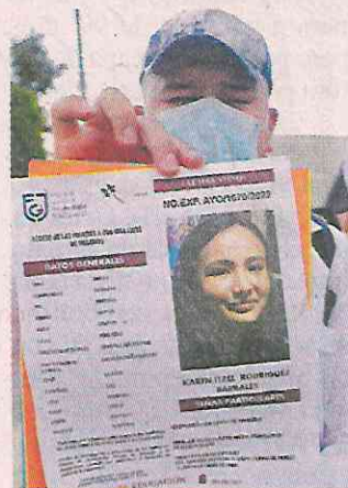
■ La egresada de Odontología desapareció el 19 de mayo.