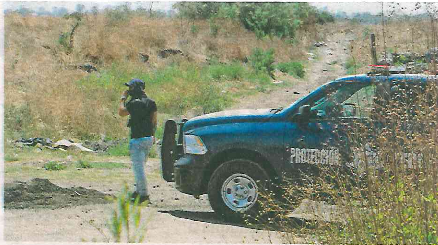
La estudiante del Poli podría haber sido abandonada por su expareja y cómplices allí