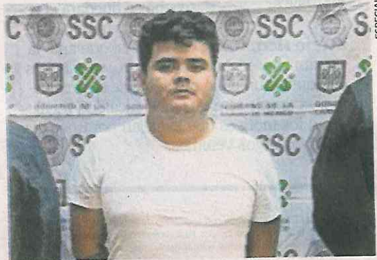
El también Pirata de Culiacán ingresó al Reclusorio Norte en 2019 por delitos contra la salud.