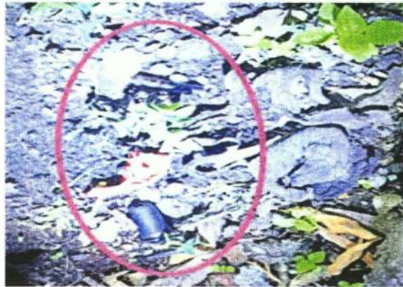
En una jardinera en el sitio del ataque, agentes hallaron dosis de droga, que integraron a las indagatorias.