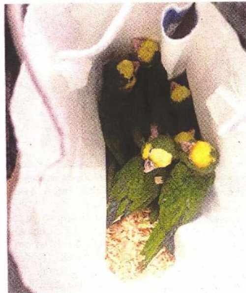
El 15 de mayo, la policía capitalina incautó mil 500 aves y dos monos capuchinos en Iztapalapa.