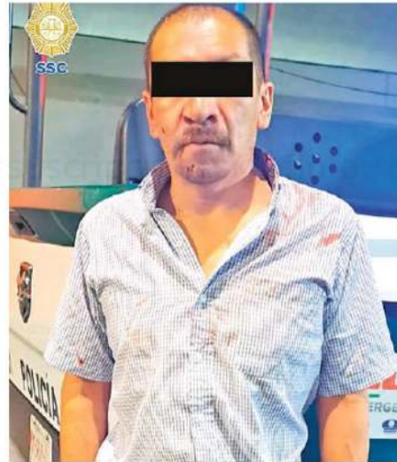
Este hombre, de 48 años de edad, es señalado por una vecina de ser el agresor

Por lo anterior, el hombre de 48 años de edad fue detenido, se le informaron sus derechos de ley y fue puesto a disposición del agente del Ministerio Público correspondiente, quien será el encargado de definir su situación jurídica e integrar la carpeta de investigación del caso.