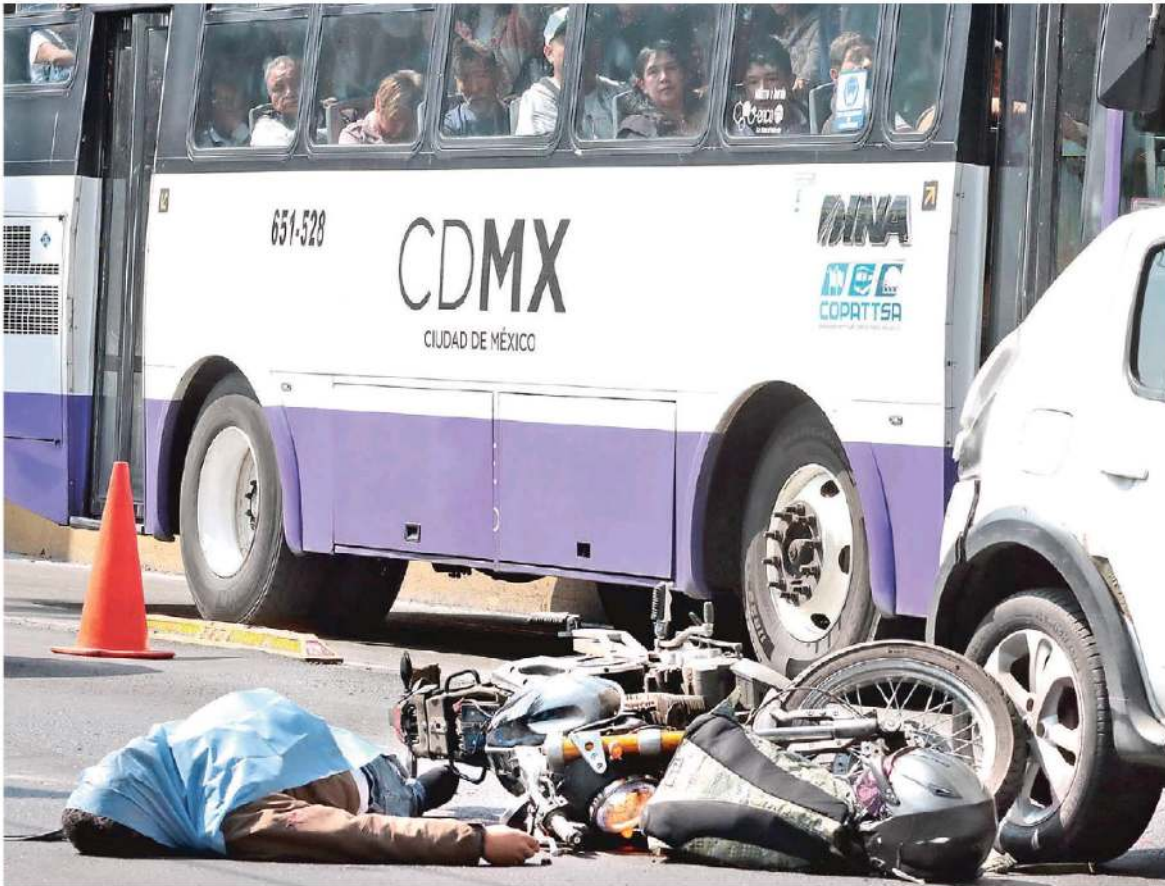
Ayer falleció este motociclista al impactarse con la parte trasera de un auto, al llegar al puente vehicular de la calle Economía, colonia Federal