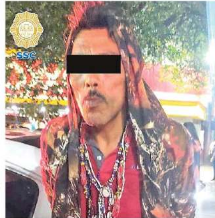
El sujeto , de 35 años de edad, fue presentado ante el MP junto con lo asegurado

En atención a la denuncia el hombre de 35 años de edad fue detenido, se le informaron sus derechos de ley y junto con lo asegurado, fue presentado ante el agente del Ministerio Público quien determinará su situación legal.