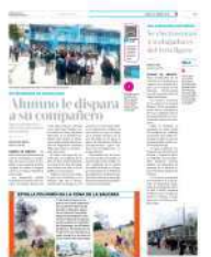
Gran movilización de los bomberos