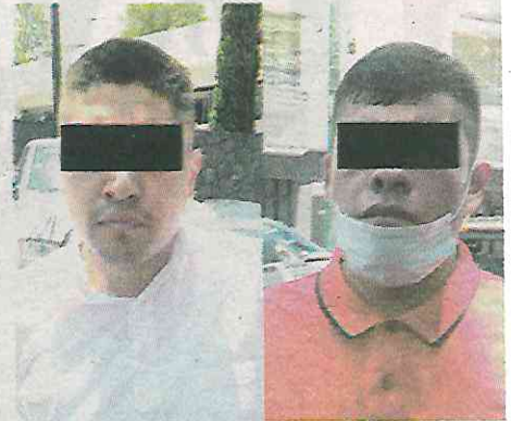
Dos hampones detenidos