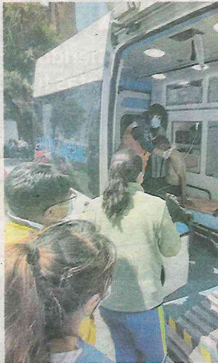
El guardia de seguridad herido

El frustrado atraco y tiroteo se registraron poco antes del mediodía en la calle Martín Mendalde y Félix Cuevas, donde varios sujetos intentaron robar una casa, pero fueron sorprendidos por un custodio del Cuerpo de Servicios Auxiliares del Estado de México (Cusaem), quien les hizo frente a los delincuentes y se desató una balacera.