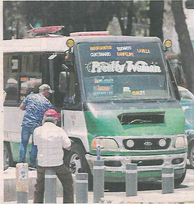
■ En los peseros, los robos con y sin violencia sumaron 230 en el primer semestre del año.

En los peseros, los robos con y sin violencia sumaron 230 víctimas de enero a junio de este año, frente a las 366 del mismo periodo de 2020, de acuerdo con la información de la Fiscalía.