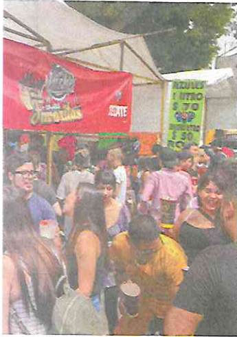
En chelerías hacen falta medidas sanitarias, reconoce el secretario.