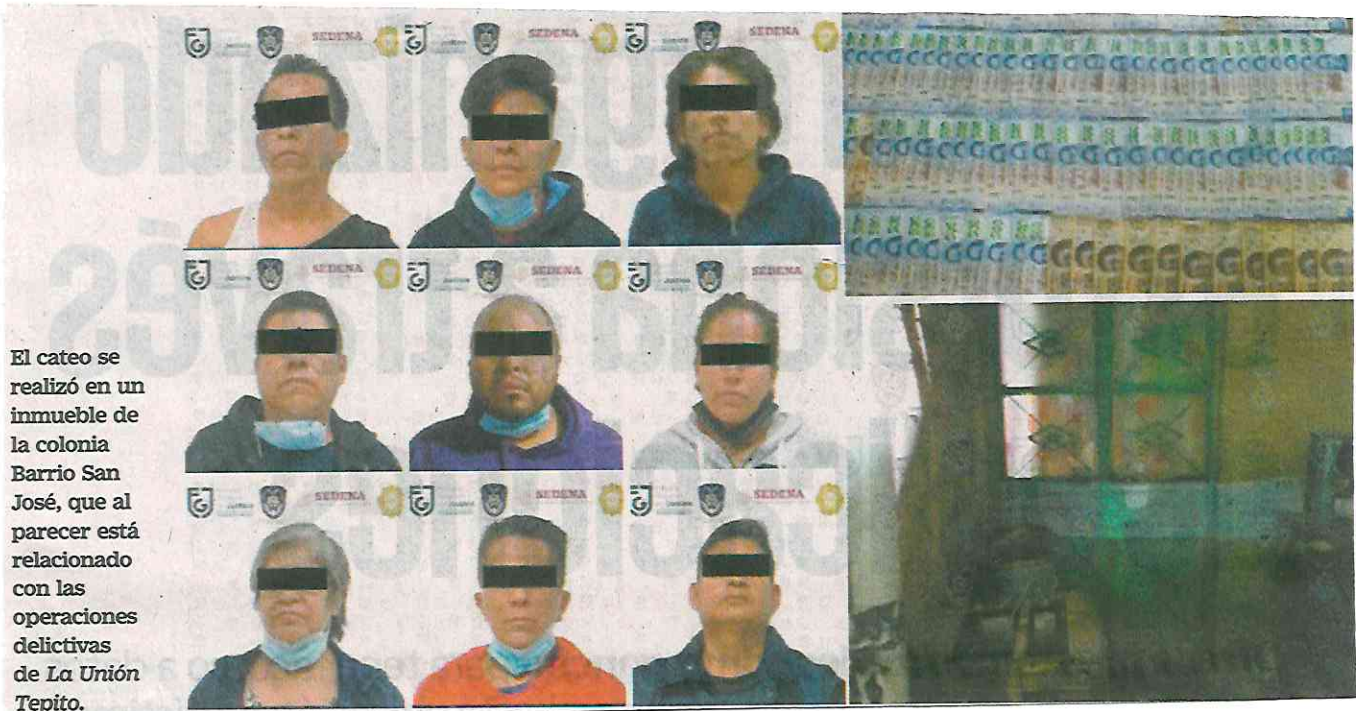
El cateo se realizó en un inmueble de la colonia Barrio San José, que al parecer está relacionado con las operaciones delictivas de La Unión Tepito.