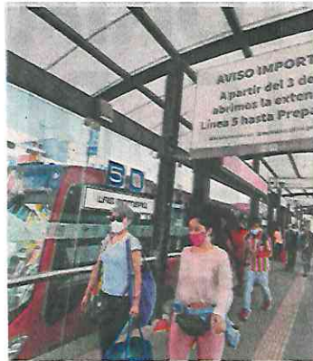
Se reforzarán ventanas abiertas en unidades y uso de cubrebocas.

En la Ciudad hay 2 mil 864 hospitalizados por Covid, 343 menos a la semana previa. ●