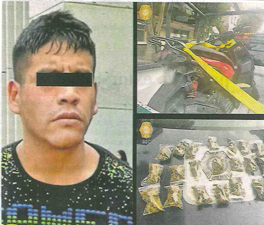
Intentó emprender la huida; fue puesto a disposición junto con la hierba verde y la motocicleta /CORTESÍA SSC CDMX.

Cabe hacer mención que, al consultar la base de datos de esta dependencia, se pudo conocer que el detenido está relacionado en una carpeta de investigación abierta en el año 2021, por el delito de Otros Robos