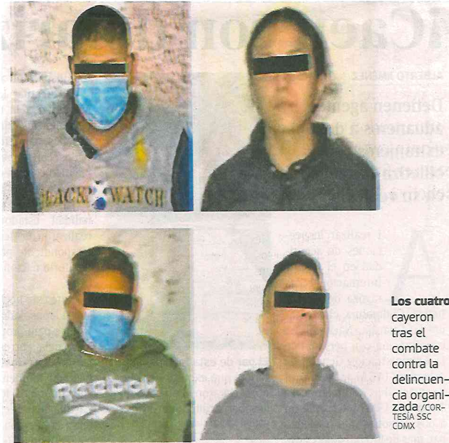
Los cuatro cayeron tras el combate contra la delincuen- cia organi- zada

na, 150 envoltorios con posible cocaína en piedra, una báscula gramera, tres teléfonos celulares y una bolsa con 44 cartuchos útiles de diversos calibres.