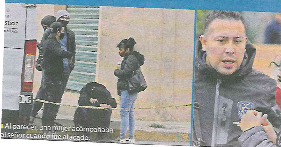
Al parecer, una mujer acompañaba al señor cuando fue atacado.