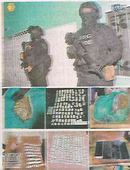
Gran surtido de estupefacientes y celulares hallaron en los cateos de varios inmuebles

Cabe destacar que, derivado del cruce de información, se tuvo conocimiento que el detenido de 33 años de edad, registra dos ingresos al Sistema Penitenciario por el delito de robo calificado; además, el detenido de 51 años de edad, registra tres ingresos al Sistema Penitenciario, todos por el delito de robo.