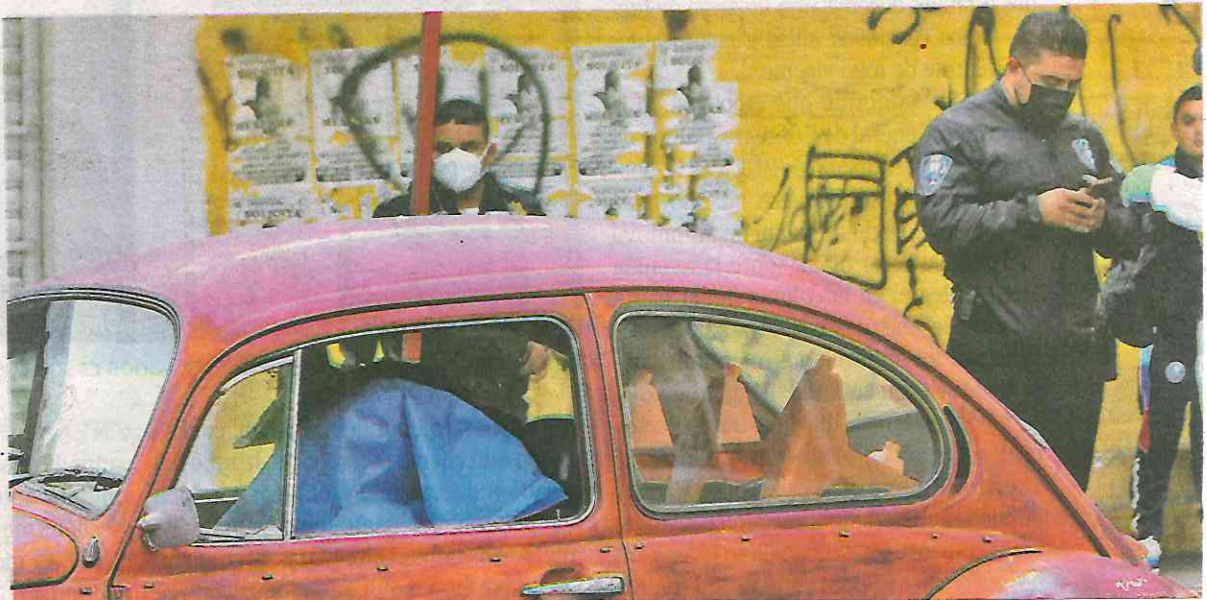
Impactada, la hija de la víctima pidió ayuda y pescaron al asesino