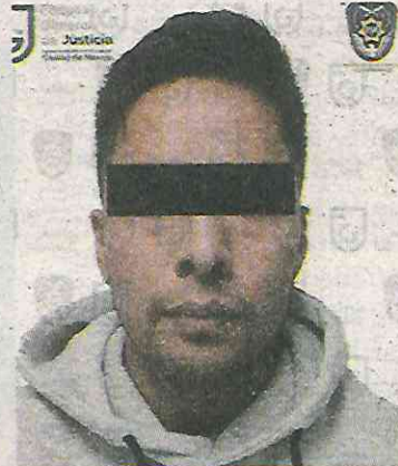
No logró escapar

De acuerdo con las primeras pesquisas, las víctimas estaban en un puesto de comida en la calle Doctor Neva, en la colonia