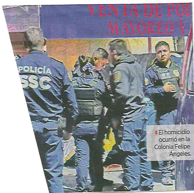
■ El homicidio ocurrió en la Colonia Felipe Ángeles.