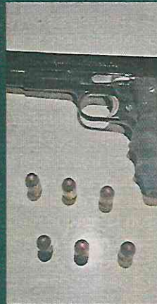
El sospechoso portaba un arma de fuego.