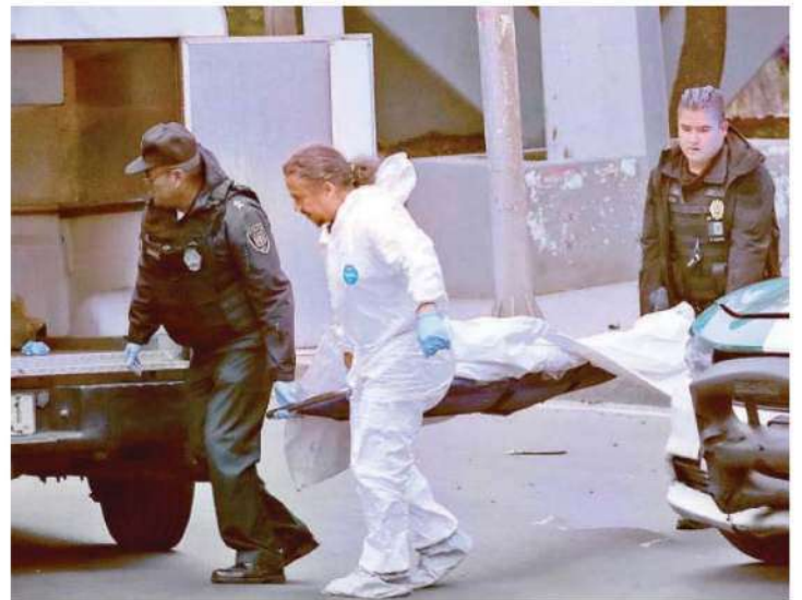
El cuerpo fue levantado por los peritos, quienes también recogieron las pertenencias del motorista, así como su vehículo, para llevarlo al anfiteatro de la demarcación