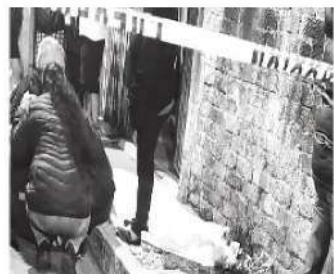
Sus compas se le voltearon

Los sujetos huyeron a bordo de 2 camionetas