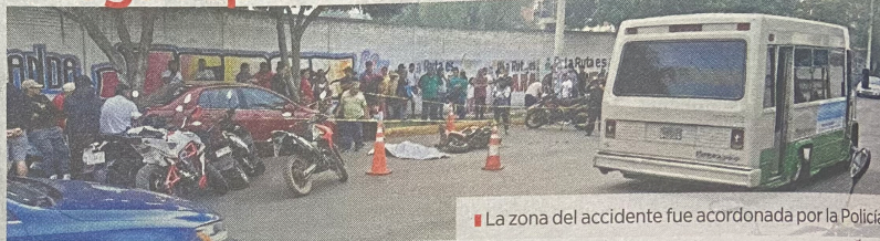
La zona del accidente fue acordonada por la Policía.