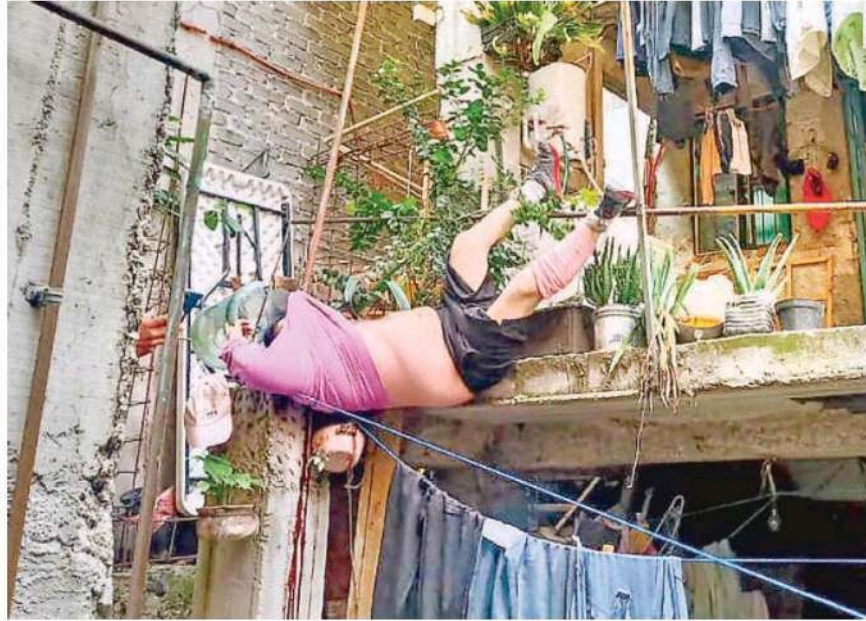
Los paramédicos nada pudieron hacer, por lo que dejaron el cuerpo intacto