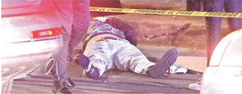
El accidente ocurrió cerca de las 06:30 horas sobre el Eje 3 Oriente Avenida Carlota Armero casi en su cruce con Cafetales