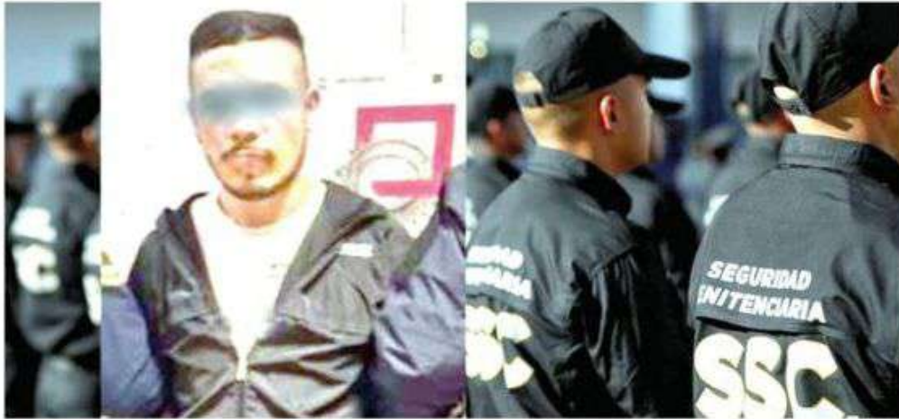
Este patán tenía retenida a una jovencita, pero lo atraparon