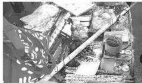
Sedema llamó a evitar la quema de pirotecnia

Los uniformados han establecido puntos de revisión en las estaciones La Merced, Candalaria, Pino Suárez, Zócalo, Allende, Bellas Artes y Jamaica