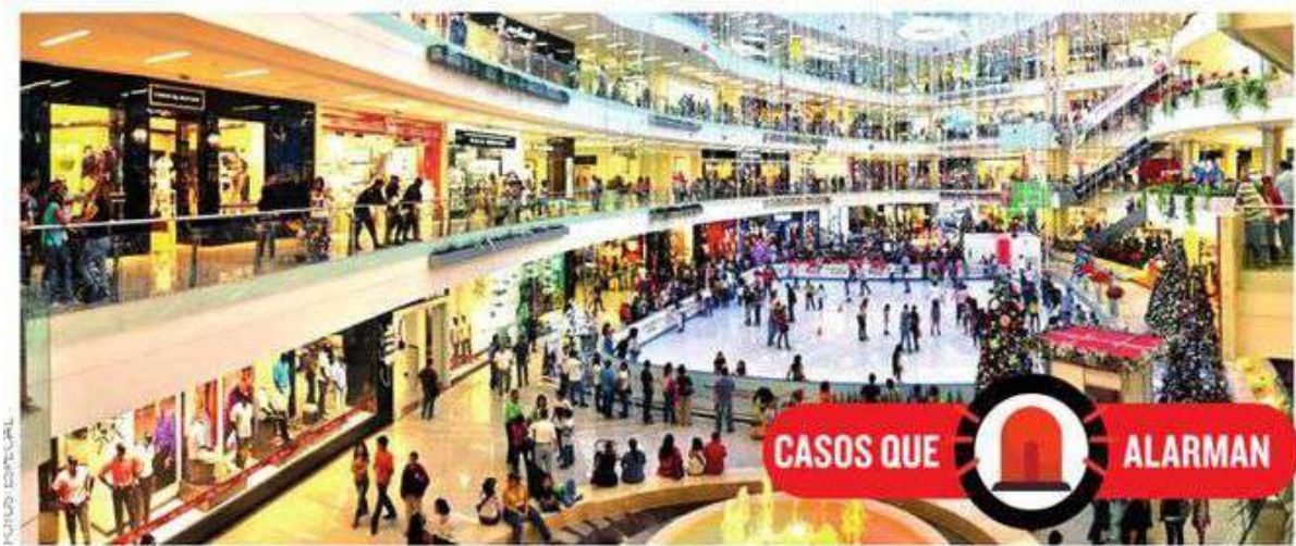
En Plaza Antara se cometió uno de los secuestros exprés