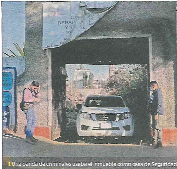
Una banda de criminales usaba el inmueble como casa de Seguridad.

Durante la búsqueda de ayer en dos sitios marcados por binomios caninos, los peritos no encontraron nada.