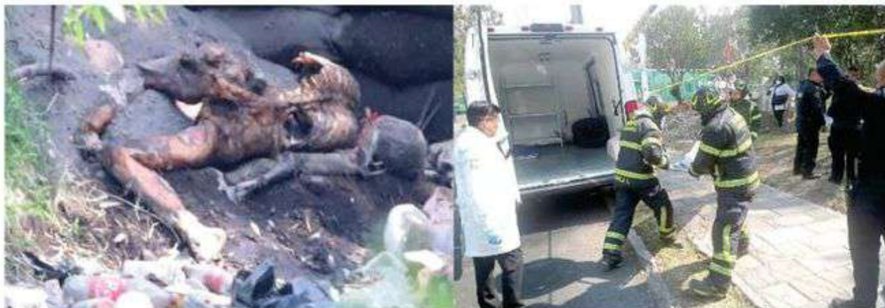
El cuerpo se encontraba totalmente descarnado