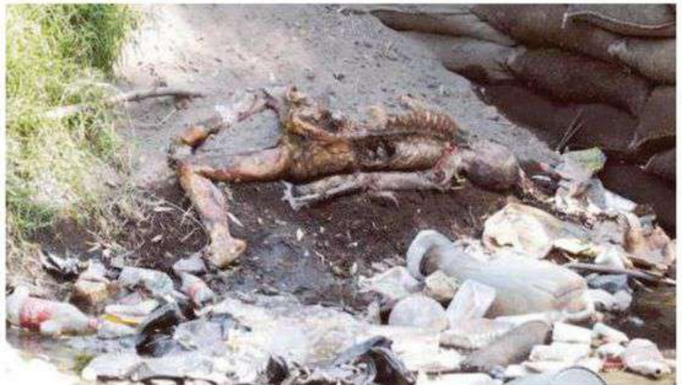
Todo parece indicar que fueron los roedores de la zona los que pudieron haber devorado parte del cuerpo de este hombre