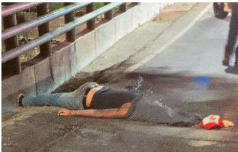
Debido a la escasa iluminación en el lugar, el hombre tras el volante no logra verlo y le pasa encima

El hombre al parecer se ganaba la vida haciendo cortes de circulación para permitir el avance de vehículos pesados