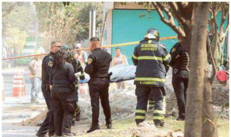
Oficiales acordonaron y resguardaron el perímetro que rodeaban los restos humanos, de los que hasta el momento se desconoce si pertenecen a un hombre o a una mujer