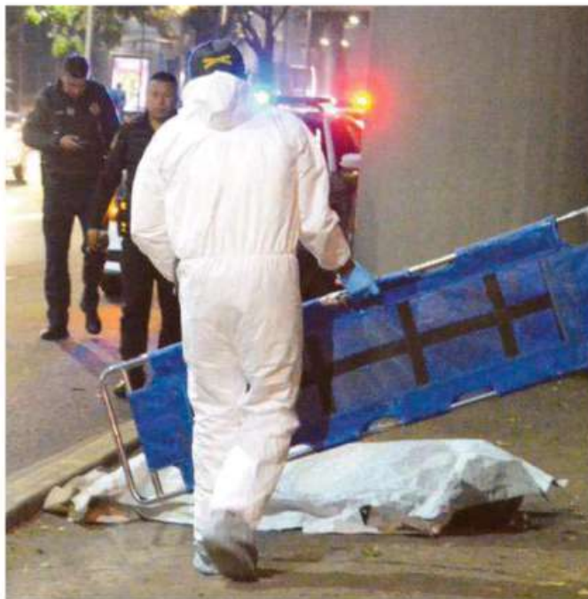
Colima fue el municipio con la tasa de investigaciones iniciadas por homicidios dolosos y feminicidios más alta, con 14 por cada 100 mil habitantes

Expuso que ocho de los diez municipios que totalizaron la mayor cantidad de investigaciones iniciadas en 2024 pertenecen a esta entidad (Toluca 30, Ecatepec de Morelos 28, Chimalhuacán 27, Ne-