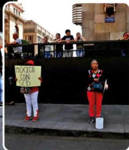
ATENCIÓN. Más de 60 integrantes del movimiento antorchista hicieron una cadena humana con cubetas para pedir que sean abastecidos del líquido.

En tanto, los manifestantes exigieron que algún funcionario del Gobierno de la Ciudad