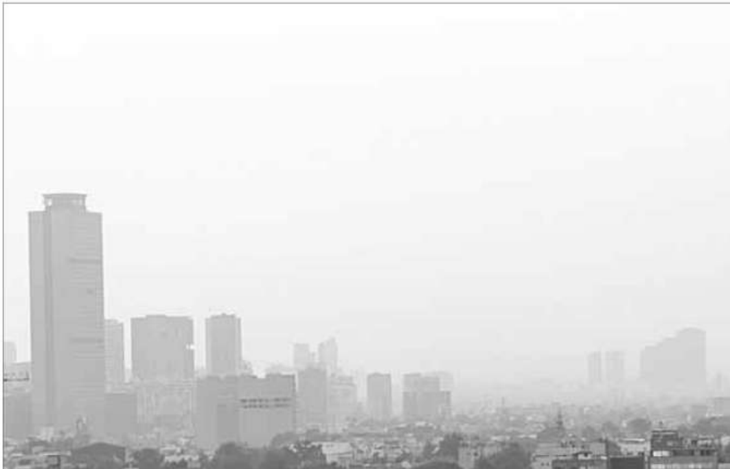
▲ En algunas zonas se reportó caída de ceniza del Popocatepetl, por lo que la Secretaría de Protección Civil emitió recomendaciones