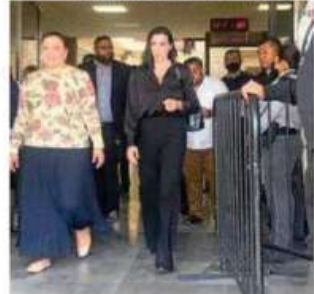
Figueiras pide justicia para su hija