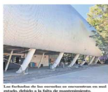
Las fachadas de las escuelas se encuentran en mal estado, debido a la falta de mantenimiento.