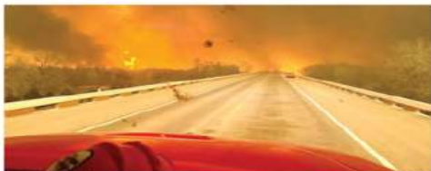
ZONAS CRÍTICAS, EL NORTE Y EL ESTE