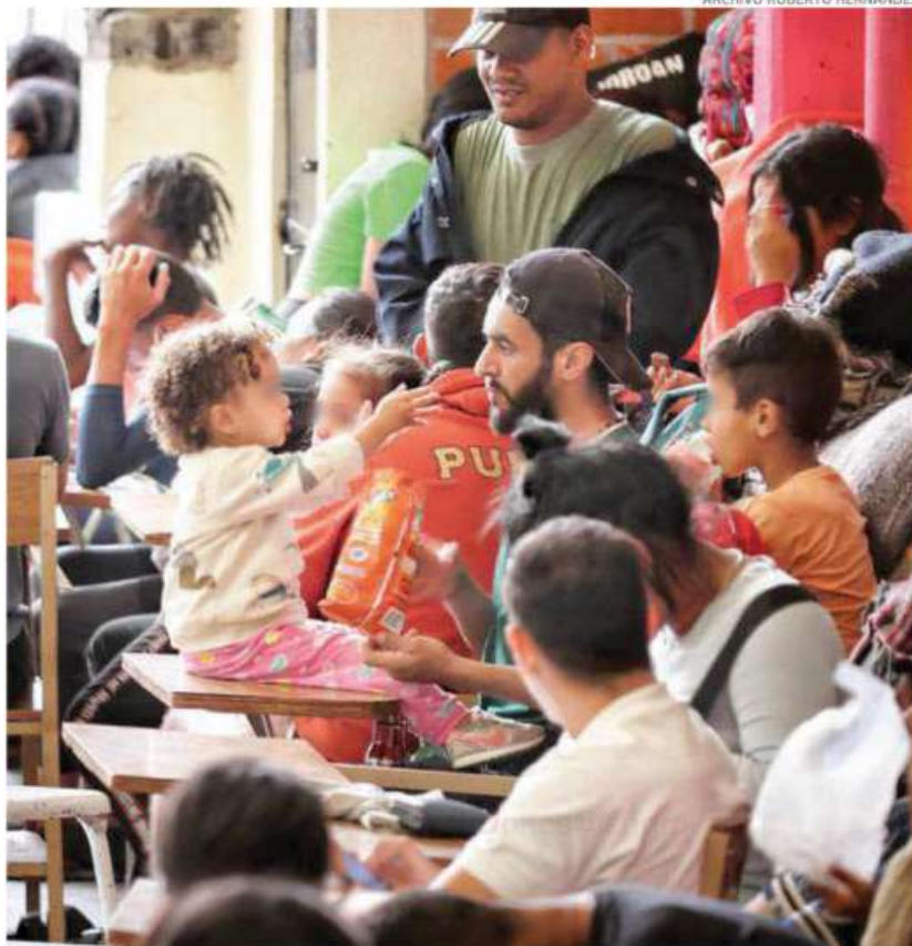
Los albergues privados de la ciudad se han reportado totalmente llenos

"Es darle a los migrantes la información necesaria sobre lo que está haciendo el Gobierno de México para apoyarlos en