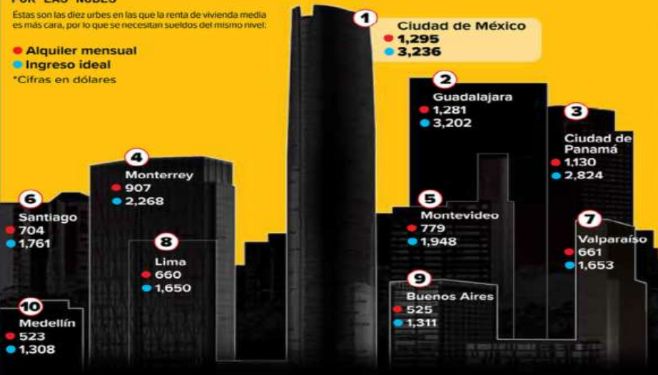
Fuente: Lamudi México, Trovit y Properati