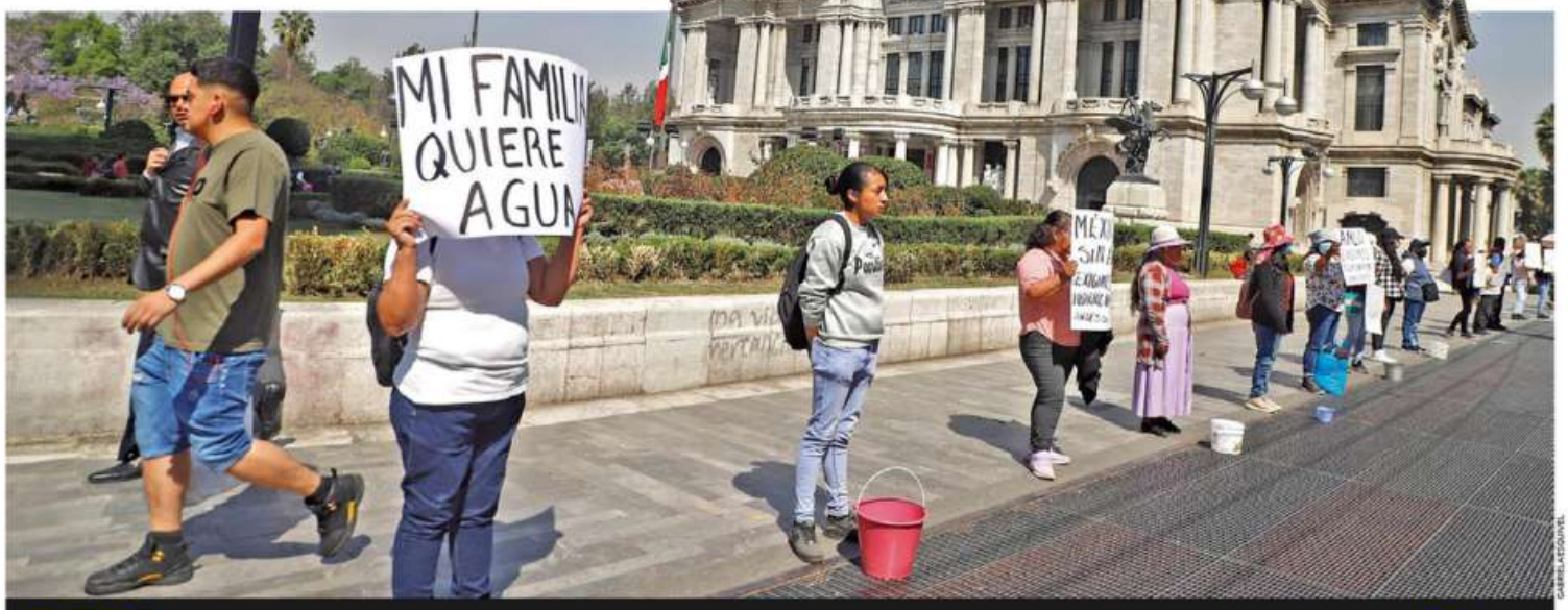
EXIGEN AGUA. Integrantes de Antorcha Campesina hicieron una cadena humana en Eje Central; pidieron al Gobierno solucionar la crisis hídrica que viven cientos de familias CDMX P. 8