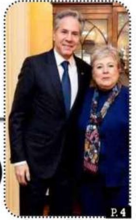
Antony Blinken, con Alicia Bárcena