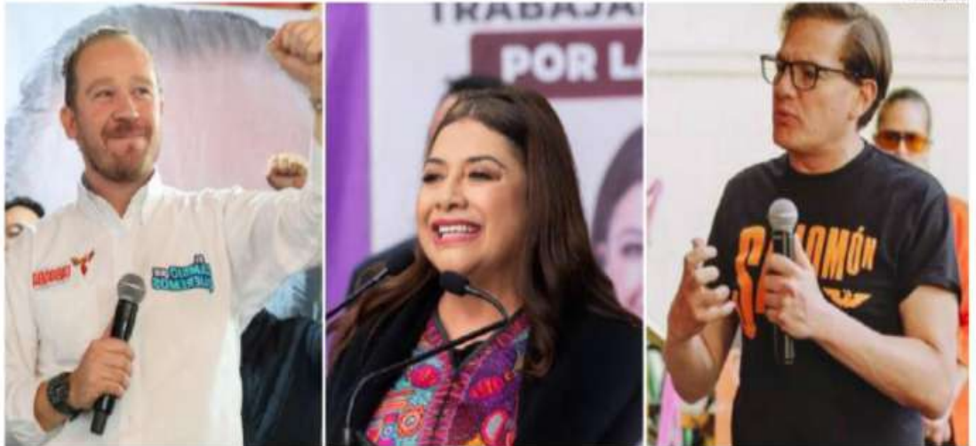
A partir del primero de marzo, los candidatos podrán acudir a todas las demarcaciones de la ciudad a emitir propuestas y planes para el futuro.

Quien aprovechará al máximo el tiempo de campaña será Salomón Chertorivski, que anunció que a las 00:00 horas de este viernes, dará su mensaje inicial en el cruce de las avenidas Juárez y Eje Central, de la colonia Centro en la al-