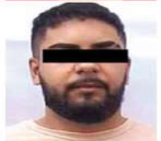
Tres españoles, uno menor de edad, fueron arrestados en la alcaldía Cuauhtémoc.