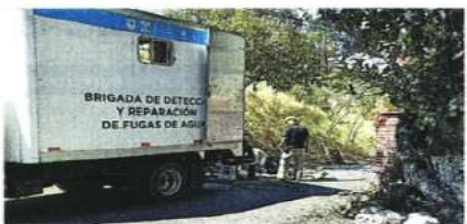
Aunque la fuga fue reportada en enero, apenas ayer una cuadrilla acudió a cerrarla.