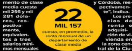
Ilustración: Erick Retana

"Esta situación deja ver la necesidad de no apostar por una política de desarrollo centralizada en los servicios, sino también de proveer y planificar en la periferia. Poco sirve una vivienda en la periferia si no tienes acceso de calidad en educación, salud o empleo", señaló.