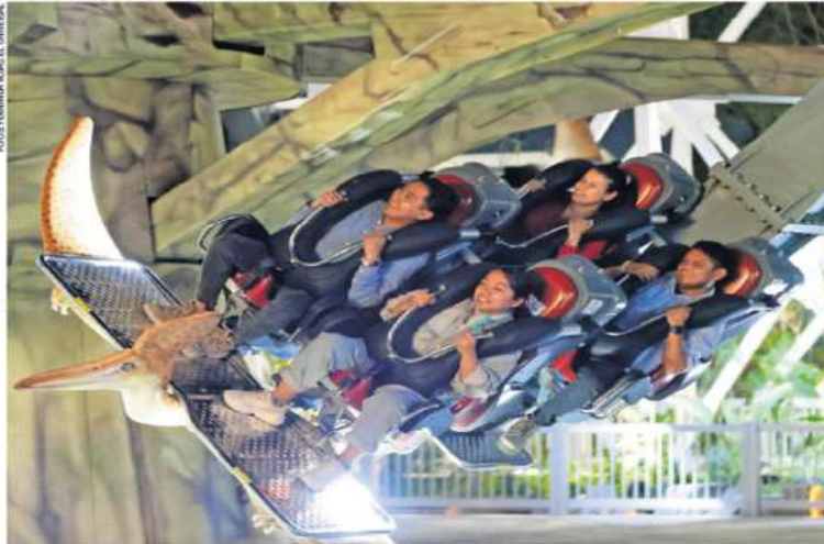
El jefe de Gobierno, Martí Batres, dio inicio a la fase de pruebas del Parque Urbano Aztlán en el Bosque de Chapultepec en 18 de las 33 atracciones, como la Rueda de la Fortuna y la Montaña Jurásica. Aún no hay fecha para su inauguración.