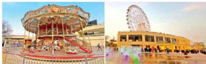
Aspectos del Carrusel Chapultepec y la Rueda de la Fortuna Aztlán 360, ayer en su encendido.

También se iluminaron las fachadas de los edificios que alojarán una sede del Museo Dolores Olmedo y el Foro de