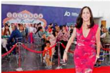
• AMOR. Limón fue testigo en boda colectiva.