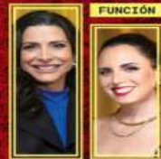
Ilustración: Homero Sierra

La escudería austriaca tiene el mejor auto y a los dos mejores pilotos, por lo que es la favorita en la nueva temporada de F1.