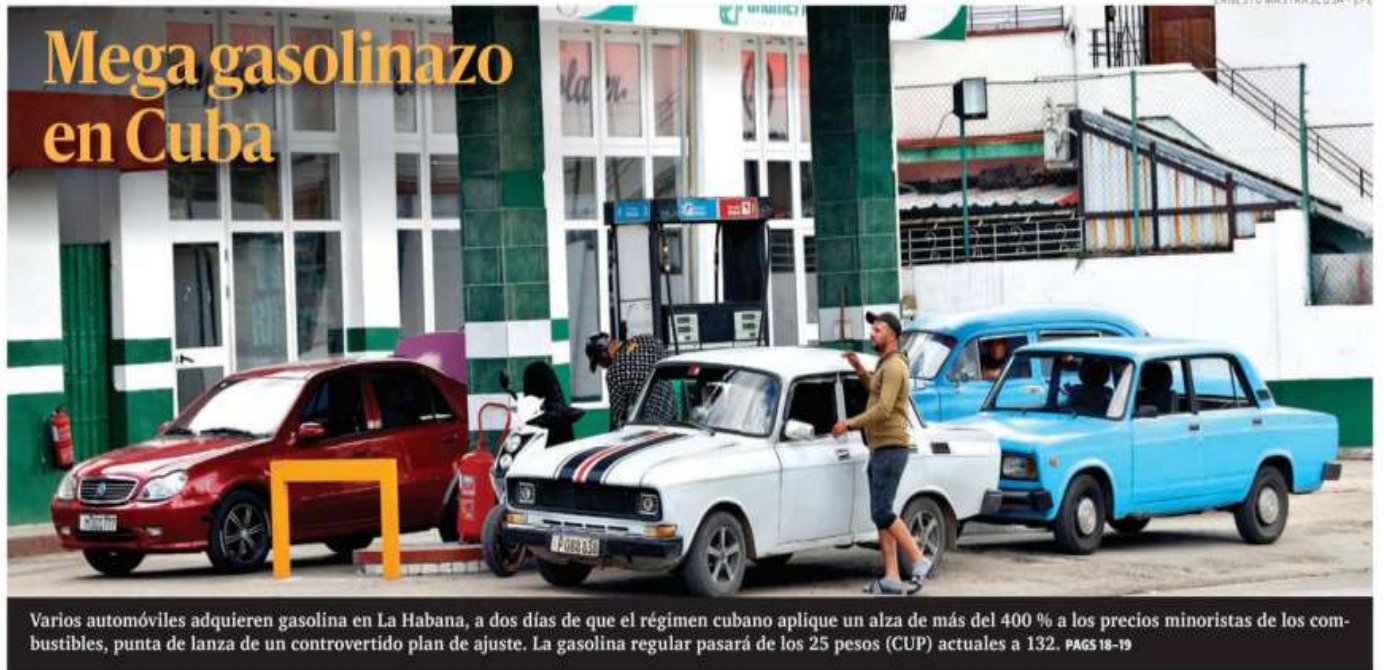
Varios automóviles adquieren gasolina en La Habana, a dos días de que el régimen cubano aplique un alza de más del 400 % a los precios minoristas de los combustibles, punta de lanza de un controvertido plan de ajuste. La gasolina regular pasará de los 25 pesos (CUP) actuales a 132. PÁGS 18-19