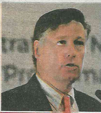
Christopher Landau, ex embajador de EU.

“Ha adoptado básicamente una actitud de dejar hacer ante los cárteles, lo cual es obviamente problemático para nuestro gobierno. Es un gran problema para México... Tiene una agenda doméstica muy ambiciosa que es, en su mayoría, sobre programas sociales. Quiere esta gran sociedad en México y ve a los cárteles, si se me permite la analogía, como su Vietnam, que lo ha sido para