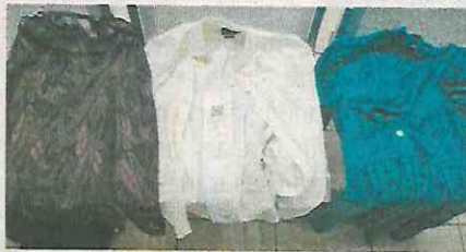
Ambos eran totalmente ladrones y los pescaron con mercancía de marca