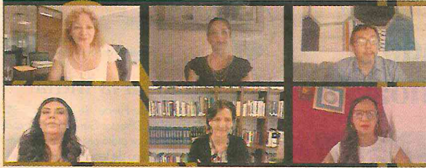
La organización civil presentó ayer la segunda edición del Observatorio de la Transición.