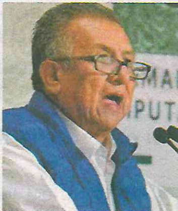
· Diputado en fuga

Sheinbaum defendió el actuar de las dependencias, encabezadas por Ernestina Godoy y