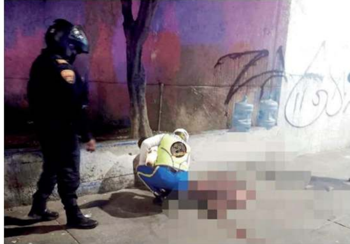
Falleció a los pocos minutos