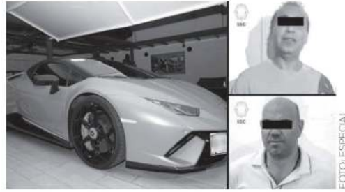
· Andaban descalzos