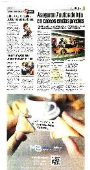
Los cateos se realizaron en predios ubicados en Tlalpan y Magdalena Contreras.