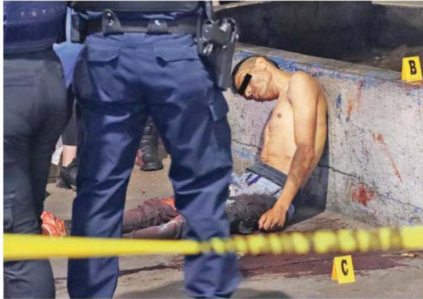
El sujeto quedó inmóvil, con el torso desnudo, el pantalón ensangrentado y los tenis blancos que llevaba puestos terminaron teñidos de rojo