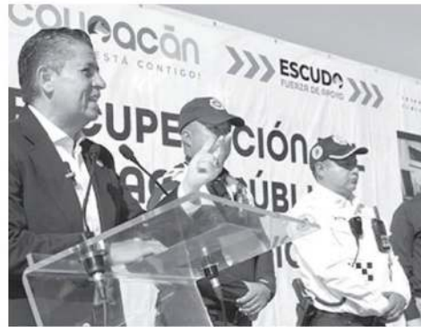
- En beneficio de los habitantes de la zona