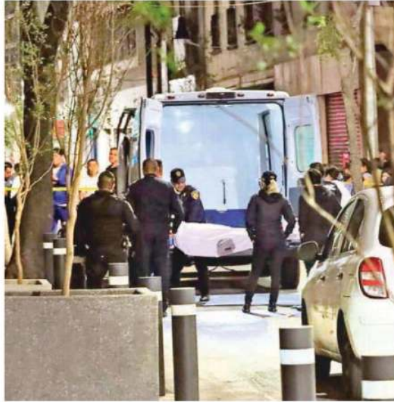
Un joven de 18 años de edad fue asesinado y su acompañante, de 17, lesionado con arma de fuego