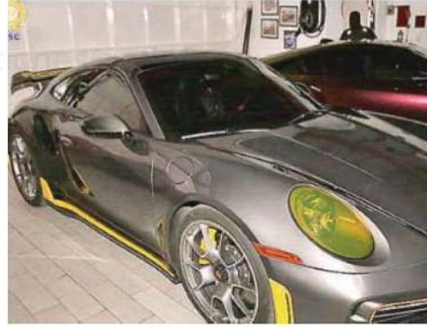
Se aseguró una camioneta de alta gama con reporte de robo en Estados Unidos, un auto deportivo también hurtado y un arma de fuego corta