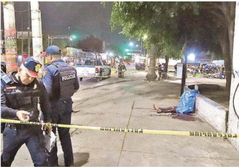
La víctima , quien fue identificado como Edgar Eduardo "N", al parecer trabajaba en el mercado de quesos, quedó sentado sobre la acera a la salida de una tienda