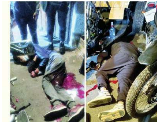
Otra matanza en esa alcaldía