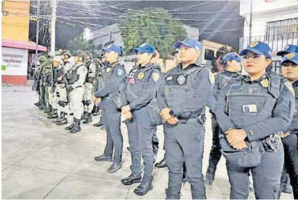
En marcha operativos policíacos en calles de Xochimilco por balaceras