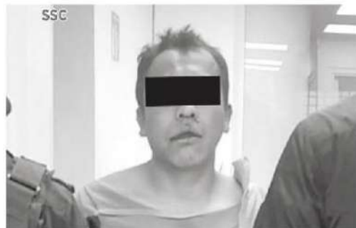
Le cayó la voladora

Cabe mencionar que los familiares del lesionado decidieron trasladarlo por sus propios medios al hospital, donde fue diagnosticado con lesión por proyectil de arma de fuego con dos impactos en el tobillo