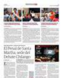
PERSONAS privadas de su libertad al mirar el Debat Chilango del 21 de abril.