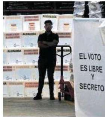
Presentarán propuestas a presos en prisión preventiva.

El debate será grabado y será transmitido de manera posterior por las redes sociales del órgano electoral. En presencia de las representaciones de los partidos políticos, se realizó el sorteo de intervenciones.