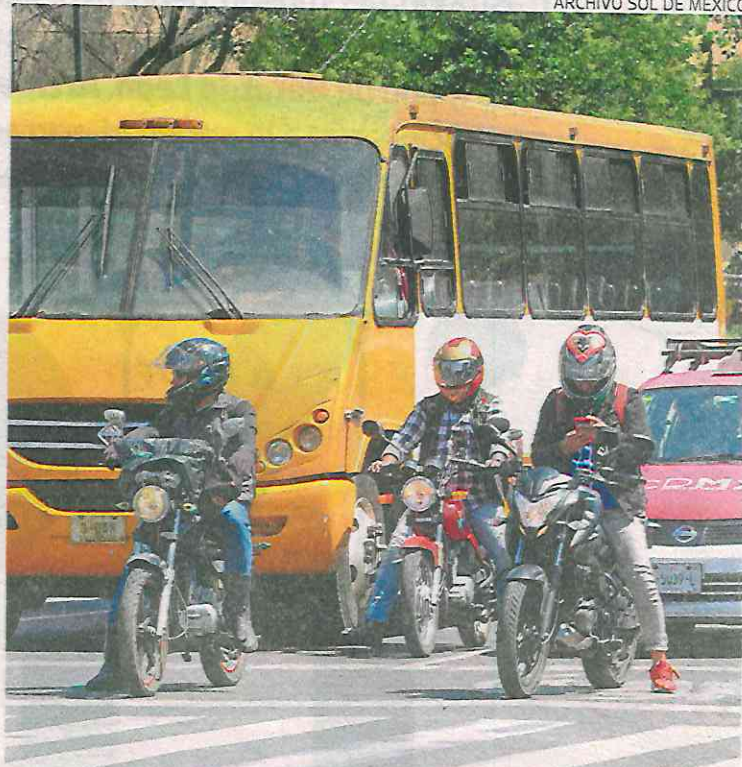
Las autoridades promueven licencias para cada tipo de conductor

Precisó que las personas cuyo plástico sea permanente no deberán tramitarla, pues podrán circular sin necesidad de una