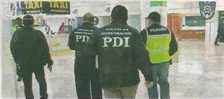
Los agentes llegaron justo a tiempo

El responsable pretendía volar hacia Miami, Florida cuando la cayó La Interpol