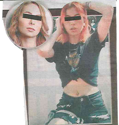
AINARA También acusó a YosStop de difundir el video de la agresión.