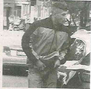
· Delinquen a plena luz

Mientras que en mayo, el total de delitos fue de 2 mil 999. Ambas cifras demuestran que dicha alcaldía sigue siendo la