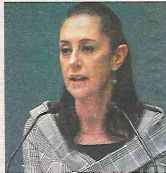
Claudia Sheinbaum, jefa de GCDMX.

Congreso capitalino se plantean reformas a Ley Orgánica del Poder Ejecutivo y de la Administración Pública, Ley Orgánica de la Secretaría de Seguridad Ciudadana, Ley del Sistema de Seguridad Ciudadana, Ley de Acceso de las Mujeres a una Vida Libre de Violencia, así como expedir la Ley de Centros Penitenciarios, todas de la Ciudad de México.