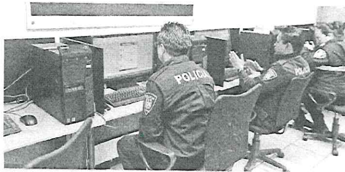
Bancos, agencias de viaje o cualquier tipo de empresa comercial aparentan enviarte correos para robar información financiera.

Para cualquier duda u orientación, así como en caso de detectar eventos sospechosos en el ciberespacio, la Policía Cibernética de la SSC, pone a disposición de la ciudadanía el número telefónico 55 5242 5100 ext. 5086. •