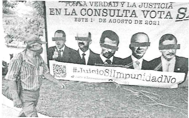
Objetivo. Morena planteó la consulta para someter a juicio a los últimos cinco ex presidentes de México, aunque la SCJN amplió el alcance al modificar la redacción de la pregunta.

MARTÍ BATRES Secretario de Gobierno de la CDMX