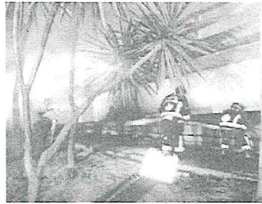
Los hechos se registraron ayer, pasadas las 7:00 horas, en Avenida Río Churubusco, Escuadrón 201.

La SSC anotó en su texto que el fuego fue controlado por completo y que esto fue provocado por personas de ese sitio que ahí instalaron con antelación una vivienda provisional, razón por la que al no contar con las medidas pertinentes de seguridad, se pueden propiciar este tipo de eventos.