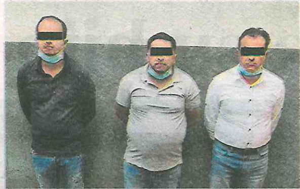
Los tres investigados por fraude, clonación de tarjetas y narcomenudeo

Cuando los sujetos se percataron de los elementos de la Secretaría de Seguridad Ciudadana (SSC), comenzaron a actuar de manera inusual y uno de ellos trató de abordar un vehículo de lujo, color negro con rojo de la marca