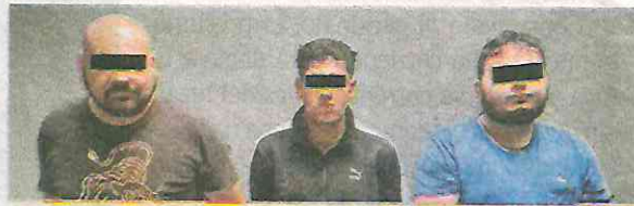
Fueron detenidos in fraganti delinquiendo, uno de ellos es venezolano

A la hora de su detención se les aseguró en los vehículos, una bolsa de plástico color negro conteniendo en su interior 100 bolsitas de plástico transparente con cierre hermético conteniendo vegetal verde característica propias de la marihuana; un cuadro envuelto en plástico.