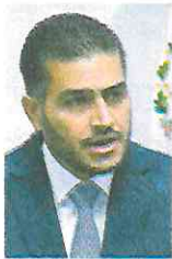
Omar García Harfuch

:::: De concretarse la reforma para que las cárceles de la capital del país pasen al control