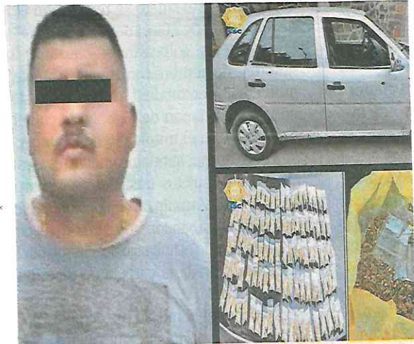
Al sujeto le aseguraron 97 dosis con aparente marihuana, una bolsa con 200 gramos de la misma hierba y dinero

Además, se pudo saber que el detenido registra un ingreso al Sistema Penitenciario de la Ciudad de México y una detención por robo a negocio sin violencia en 2017.