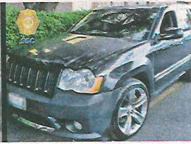
Les aseguraron un vehículo y varios objetos al par de detenidos