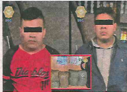
Su nerviosismo los delató

Ante este comportamiento y para descartar la posible comisión de un delito, los oficiales se acercaron a los sujetos a quienes les mencionaron que les realizarían