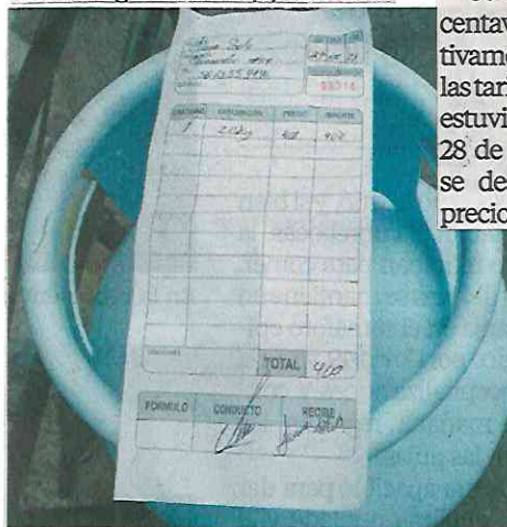
La venta de tanques de Gas Bienestar en Iztapalapa fue por fichas, explican vecinos.

Al preguntarle si se ha identificado algún foco rojo, comentó