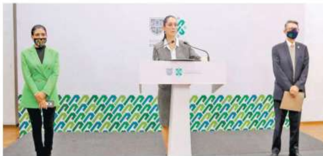
Interrumpen su embarazo 227 mil 686 mujeres en 13 años de aprobación de ILE

"Es muy importante para nosotros porque forma parte del conjunto de derechos sexuales y reproductivos y por el de-