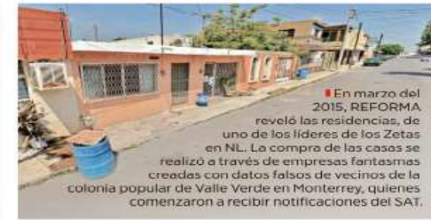
En marzo del 2015, REFORMA reveló las residencias, de uno de los líderes de los Zetas en NL. La compra de las casas se realizó a través de empresas fantasmas creadas con datos falsos de vecinos de la colonia popular de Valle Verde en Monterrey, quienes comenzaron a recibir notificaciones del SAT.