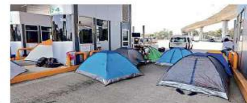
Grupos de manifestantes instalaron casas de campaña mientras extorsionan en la caseta de Tlalpan.

porte establecido cuenta con su sistema de telepeaje para cobro inmediato y cuando tenemos los bloqueos los manifestantes nos exigen botear. "Si no lo hacen nos rayan los camiones o los dañan, y tenemos que hacer el pago de dinero y el lector de todos modos nos carga la tarjeta", explicó.