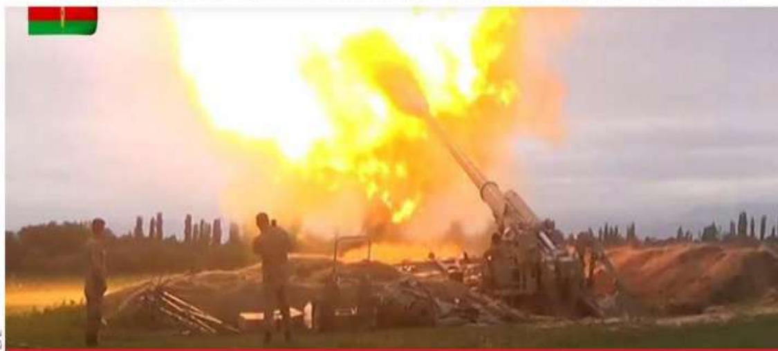
Fotografía del Ministerio de Defensa de Azerbaiyán muestra los supuestos disparos de artillería contra las posiciones enemigas desplegadas en la proclamada República de Nagorno-Karabaj, en disputa con Armenia. Los enfrentamientos armados comenzaron el domingo. El presidente de Azerbaiyán, Ilham Aliiev, decretó ayer una movilización parcial debido a la escalada de los choques. En este conflicto, Rusia respalda a Armenia y Turquía a Azerbaiyán.