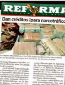
Dan créditos (para narcotráfico)

Narcobanco En mayo de 2018 fueron capturados con 10.4 mdd en la CDMX: 6 chinos 4 mexicanos ■ Según la FGR, el grupo financiaba a diferentes cárteles para comprar cargamentos de droga. ■ Solicitó condenas de 23 a 29 años de prisión por delincuencia organizada y lavado de dinero.