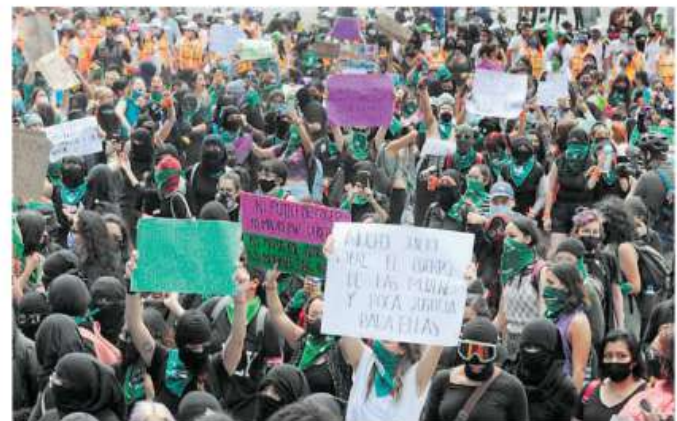
La policía dijo que no se usó gas