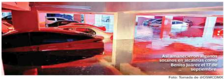
Así finalizó el día algunos sótanos en alcaldías como Benito Juárez el 17 de septiembre

En tanto, la Secretaría de Gestión Integral de Riesgos y Protección Civil es la que ha emitido alertas por riesgos ocasionados por las lluvias y las ha difundido en sus redes sociales.