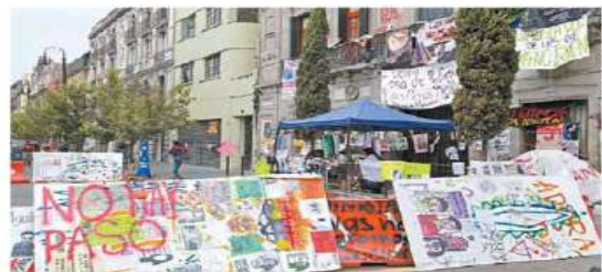
La sede de la CNDH en el Centro Histórico está tomada por grupos feministas desde el pasado 2 de septiembre.

Además incluyó una fotografía entregando viveres. ●