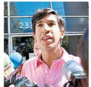
Más contendientes.

Red de Refugios lo niega Segob denuncia que grupos cobran por gestión de casos L. PADILLA Y S. ROJAS - PÁGS. 6 Y 7