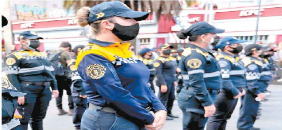
Mujeres que forman parte de la SSC han denunciado que para obtener una patrulla, acceder a otros cargos o ser asignadas a un sector cercano a sus hogares, algunos mandos policíacos les piden favores sexuales.

Tras la instalación de las comisiones ciudadanas de combate a la corrupción policial y de combate al abuso sexual, las uniformadas de la Ciudad de México han encontrado la forma de denunciar sus casos de abuso sexual,