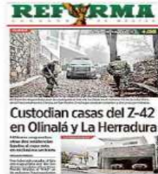
Custodian casas del Z-42 en Olinolá y La Herradura