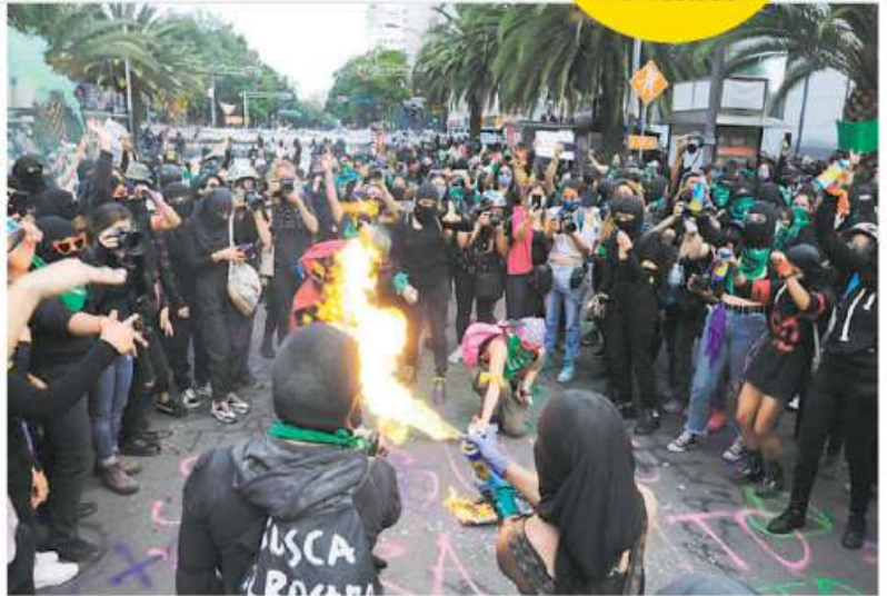
Realizaron quemas y pintas para terminar con el cerco

El cerco se creó por el vandalismo del grupo negro, según explicó el secretario de Gobierno local