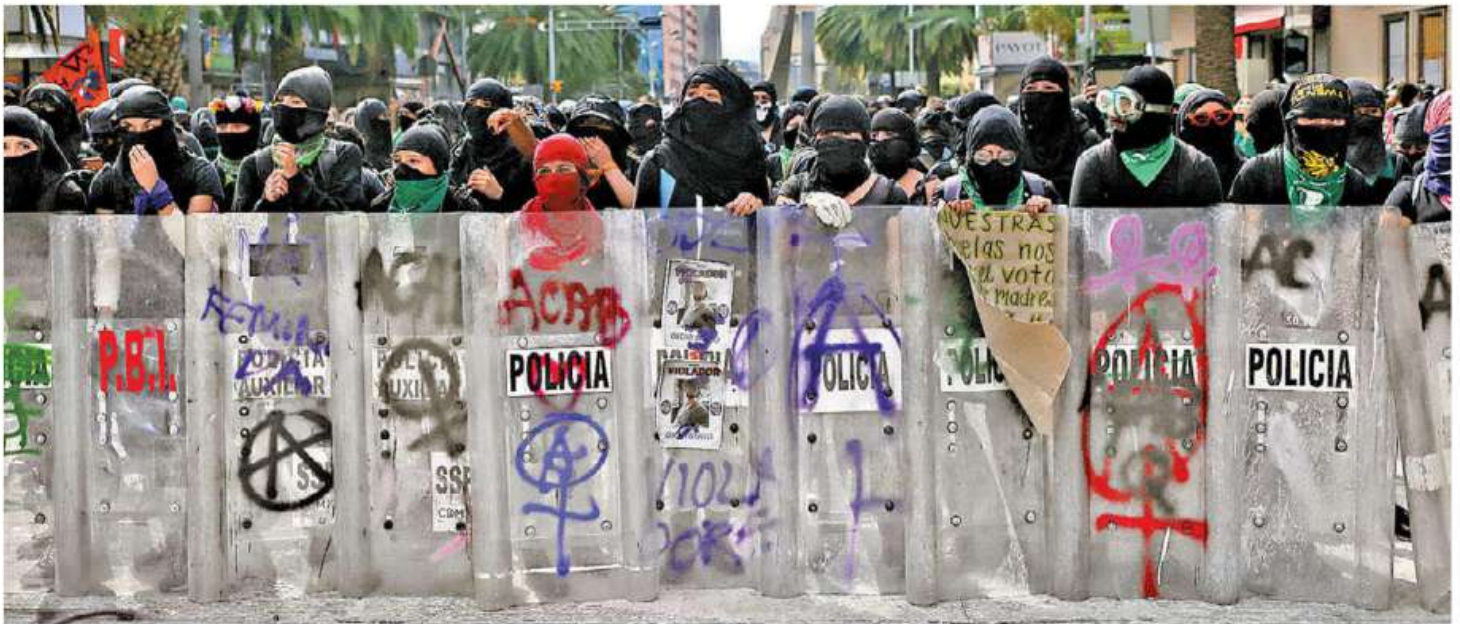
Policias impidieron el paso al Zócalo pero las manifestantes, en un momento de los enfrentamientos, despojaron a varias uniformadas de sus escudos.

Ricardo Monreal "Hay que privilegiar la negociación para no contaminar el 2021" - P. 14