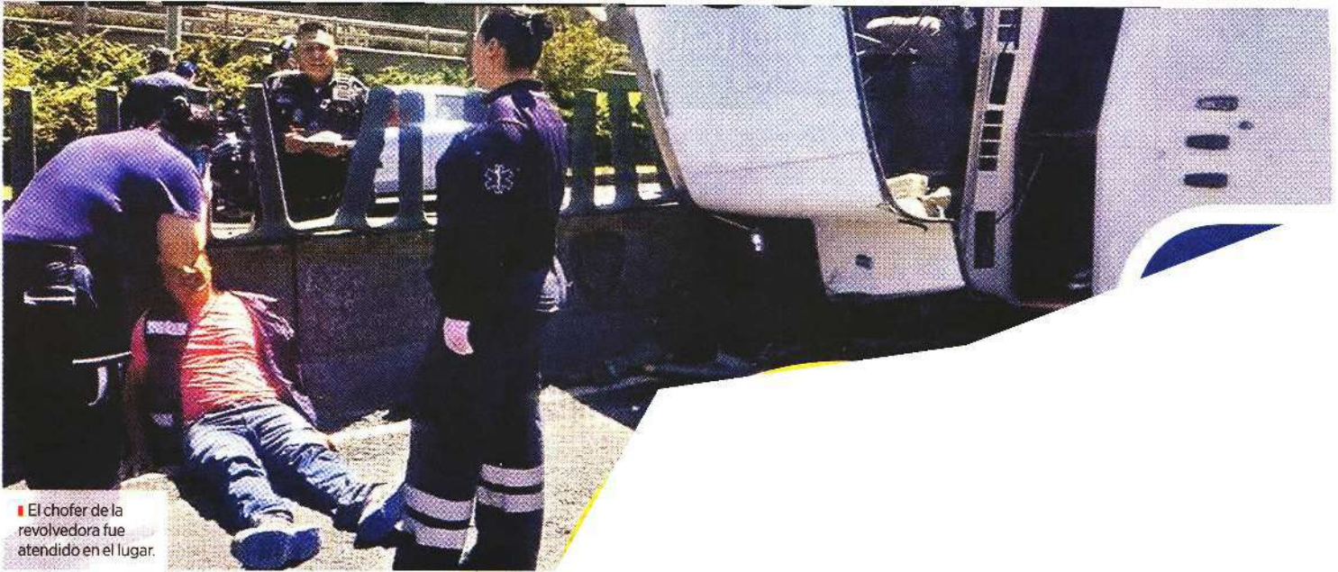
El chofer de la revolvedora fue atendido en el lugar.

C UADRUPOLO.- Una persona resultó lesionada por la volcadura de una revolvedora de concreto en la Colonia Paseo de las Lomas, Alcaldía Álvaro Obregón. De acuerdo con los primeros reportes de los servicios de emergencia, el accidente ocurrió alrededor de las 13:00 horas de este jueves, en el kilómetro 16+500 de la carretera México-Toluca, a la altura de las instalaciones del Centro de Investigación y Docencia Económicas (CIDE). Agregan que al parecer el chofer conducía a exceso de velocidad en la zona de curvas de la carretera, lo que causó el percance en el que resultó lesionado y el cual dejó también afectaciones materiales en un muro de contención y en una camioneta. El hombre que resultó herido fue atendido por paramédicos, quienes concluyeron que sus heridas no requerían del traslado del lesionado a un hospital, así que fue atendido en el lugar. La circulación en la zona, desde Santa Fe hasta Vista Hermosa, se vio afectada en ambos sentidos de la México-Toluca. Los equipos de emergencia realizaron las maniobras para colocar el vehículo pesado en su posición correcta y agilizar el tránsito.