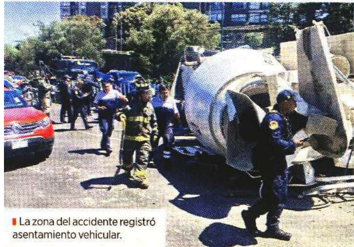
La zona del accidente registró asentamiento vehicular.