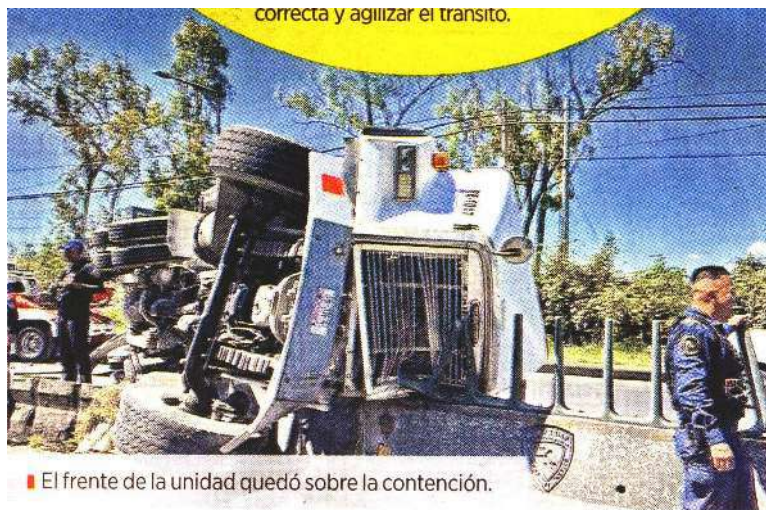
El frente de la unidad quedó sobre la contención.