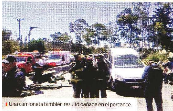
Una camioneta también resultó dañada en el percance.