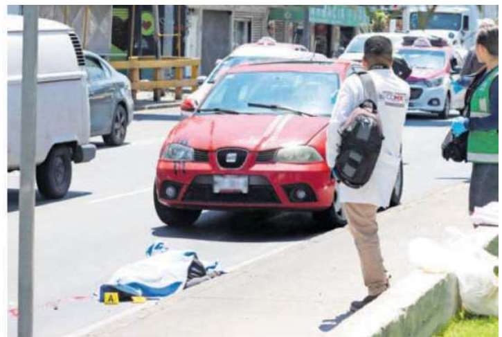
El conductor del auto fue puesto a disposición del Ministerio Público donde rendirá su declaración

El hombre cayó contra el pavimento donde quedó tendido mientras un charco de sangre comenzó a formarse debajo de su cabeza