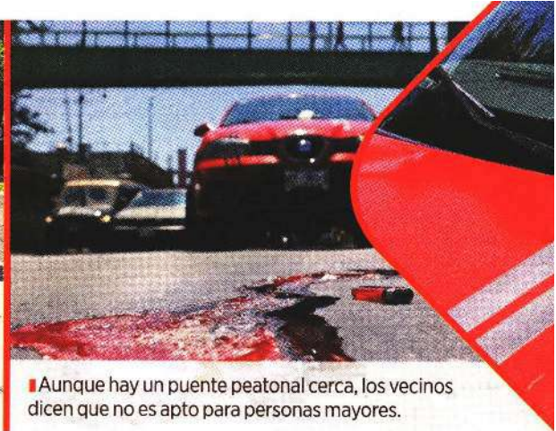
Aunque hay un puente peatonal cerca, los vecinos dicen que no es apto para personas mayores.