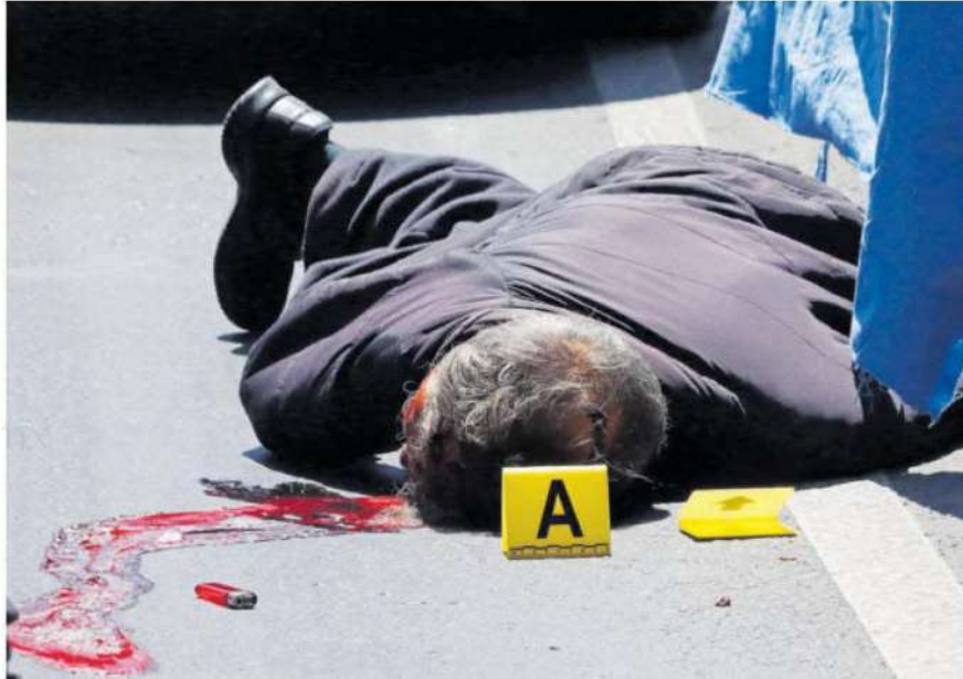
El accidente ocurrió en las inmediaciones de la Colonia Unidad Vicente Guerrero en la alcaldía Iztapalapa