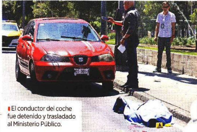
El conductor del coche fue detenido y trasladado al Ministerio Público.