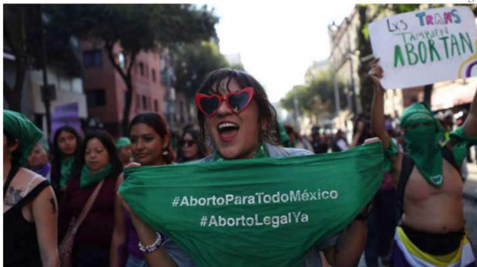
Una marcha partió del Ángel de la Independencia al Zócalo.