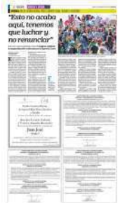
BERENICE FREGOSO EL UNIVERSAL