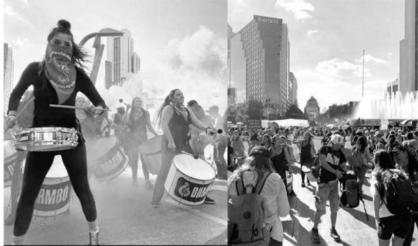
· Se estima participación de medio millar de asistentes