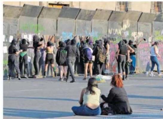
Encapuchadas, del Bloque Negro, realizaron pintas y rompieron vidrios en comercios

Al arribar al Zócalo capitalino, los colectivos organizaron un mitin durante el cual dieron lectura a sus exigencias. Asimismo, las embozadas golpearon las vallas que resguardaban Palacio Nacional y la Catedral Metropolitana.