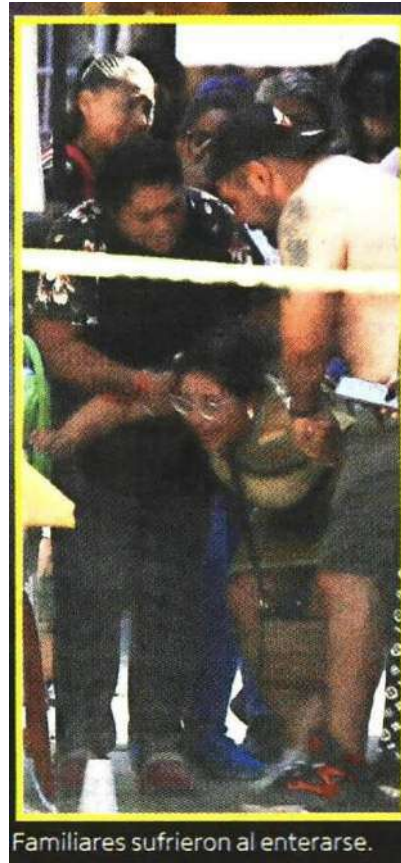
Familiares sufrieron al enterarse.