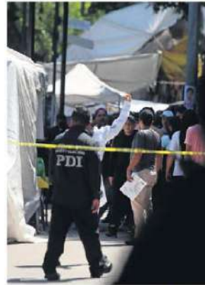
Los policías fueron alertados por el C2 sobre una balacera.