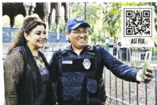
Tras la entrevista, una agente de la SSC se acercó a la Alcaldesa con licencia de Iztapalapa para pedirle una selfie.

Brugada confía en que su experiencia como diputada y titular de una demarcación le dan ventaja para representar a Morena por la Jefatura de Gobierno