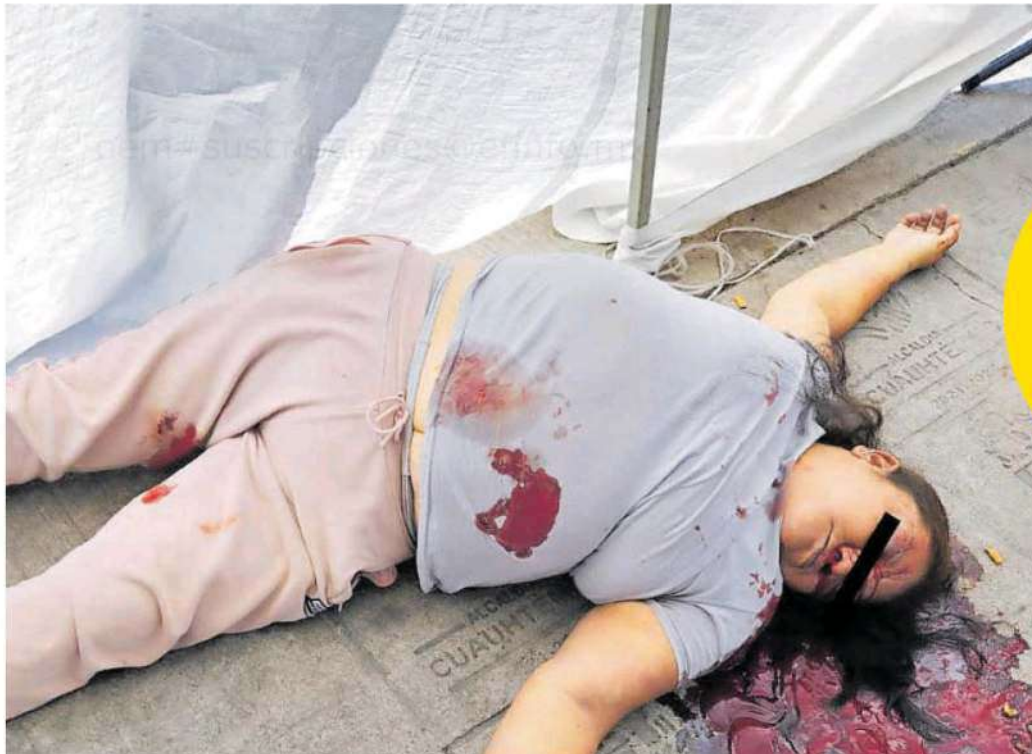
Verónica Alejandra "N" de 39 años, se dedicaba a vender nieves en un pequeño puesto ambulante, en el Barrio Bravo de Tepito