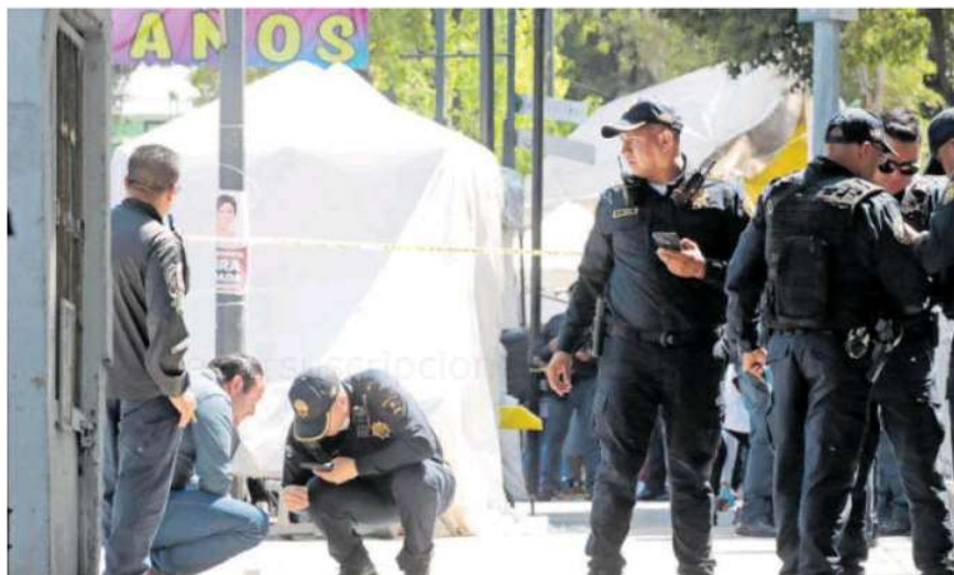
Tras el reporte de la balacera, en el sitio se dio una intensa movilización de elementos de la Secretaria de Seguridad Ciudadana SSC