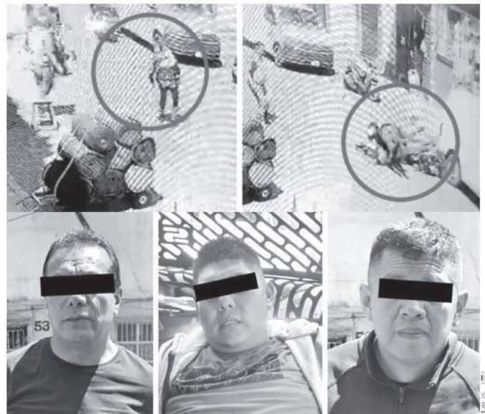
La uniformada arriesgó su vida y los capturó

Los delincuentes interceptados por la uniformada fueron golpeados por transeúntes y comerciantes que querían lincharlos