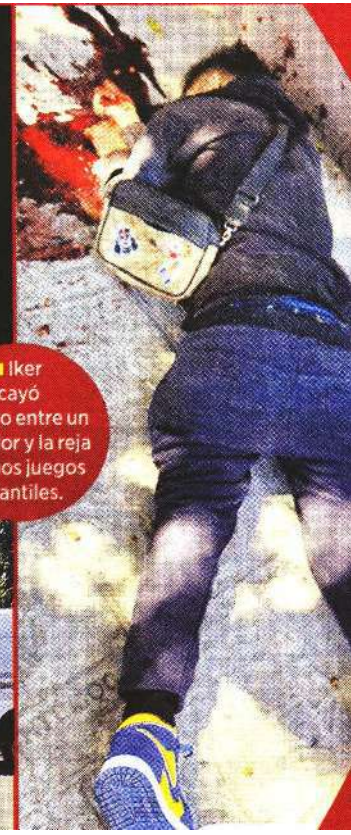
Iker cayó muerto entre un andador y la reja de unos juegos infantiles.