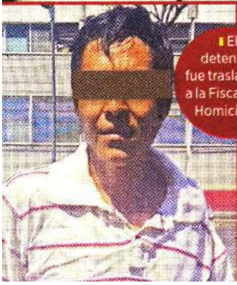
El detenido fue trasladado a la Fiscalía de Homicidios.