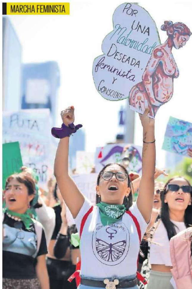
Colectivos femeninos realizaron una marcha en la que llamaron a las candidatas presidenciales a no utilizar la lucha feminista contra el aborto para fines políticos y les pidieron prometer que la apoyarán.