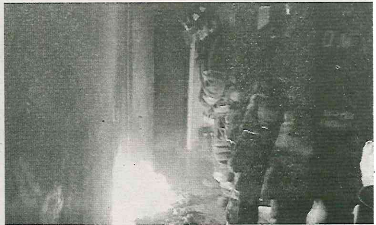
Las llamas consumieron gran cantidad de muebles en el lugar

Al arribar al lugar de los hechos, los bomberos con apoyo del personal de seguridad, evacuaron a los habitantes y apagaron las grandes llamas.