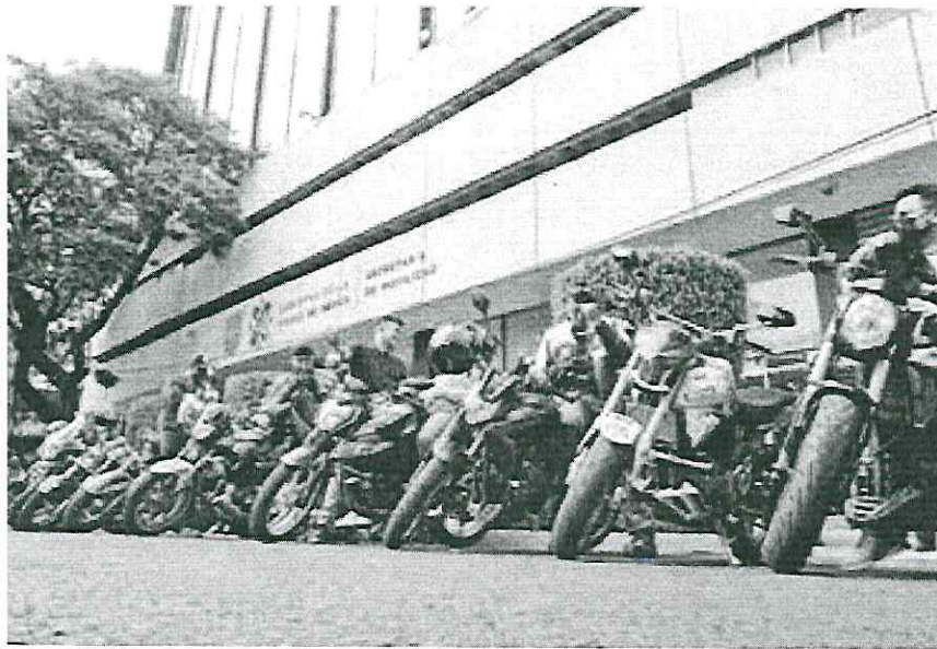
Rechazo. Motociclistas de la CDMX se opusieron y convocaron a mesas de diálogo, las cuales resultaron benéficas para que se pausara la medida.