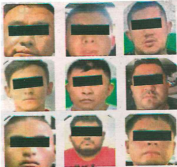
Reclutaban sicarios en la Ciudad de México para enviarlos a Playa del Carmen y Cancún

Con el objetivo de desarticular esta célula delictiva, en coordinación con la Fiscalía General de Justicia de la Ciudad de México, a quienes agradecemos su valiosa colaboración y el Centro Nacional de Inteligencia, implementamos distintas acciones operativas en días pasados que culminaron en el cumplimiento de nueve órdenes de aprehensión por el delito de Asociación Delictuosa, en contra de los integrantes de esta organización criminal, que fueron detenidos en días recientes, así como los que fueron detenidos anteriormente por la propia fiscalía.