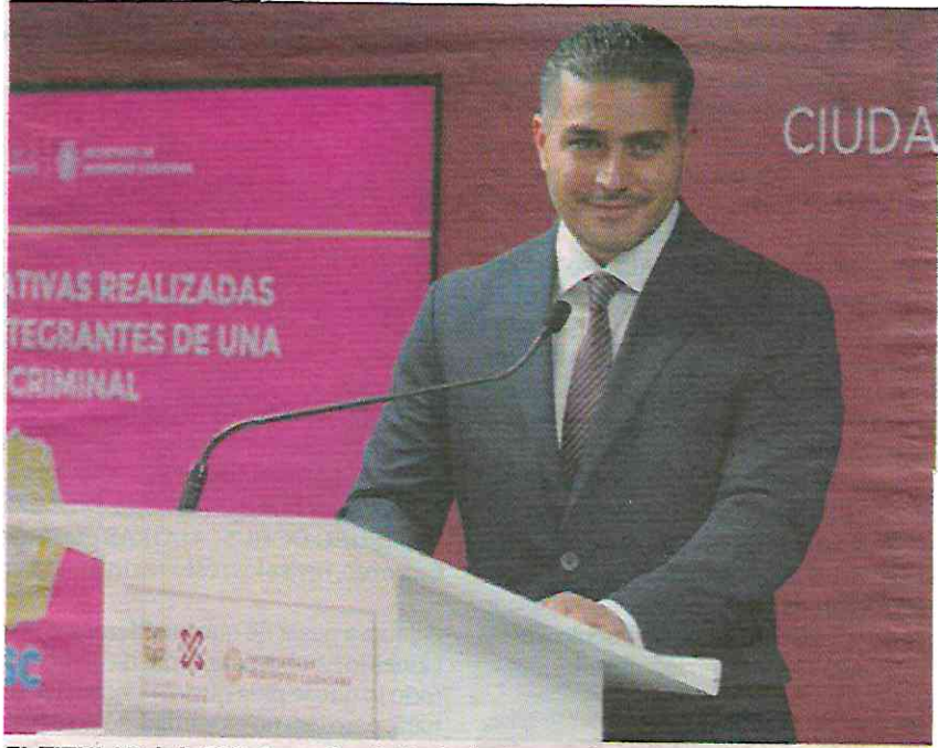
EL TITULAR de la SSC, Omar García Harfuch, durante la conferencia de prensa, ayer.