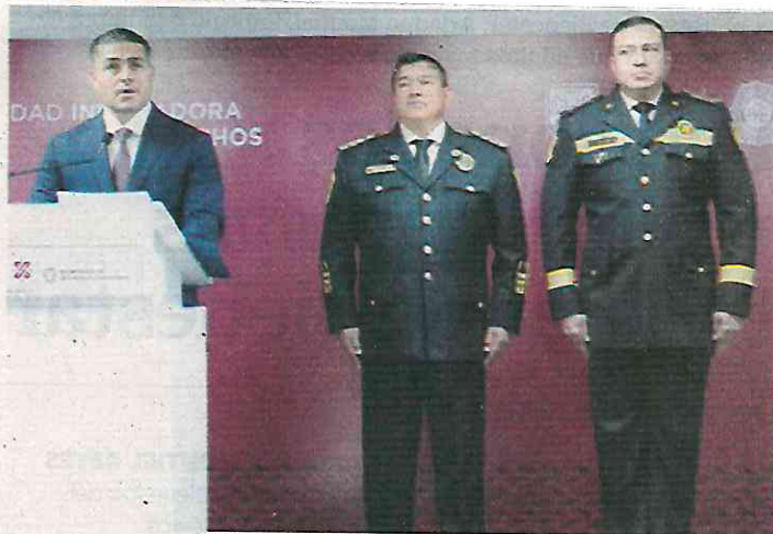
El titular de la Secretaría de Seguridad Ciudadana, Omar García Harfuch, en conferencia de prensa para informar de las detenciones.

Además, reveló el jefe de la policía capitalina, Omar García Harfuch, ese grupo de manera local extorsionaba a comerciantes, a quienes cobraban entre 50 mil y 100 mil pesos a cambio de no hacerles nada; con ese modus operandi se reportaron al menos 20 denuncias en este año.