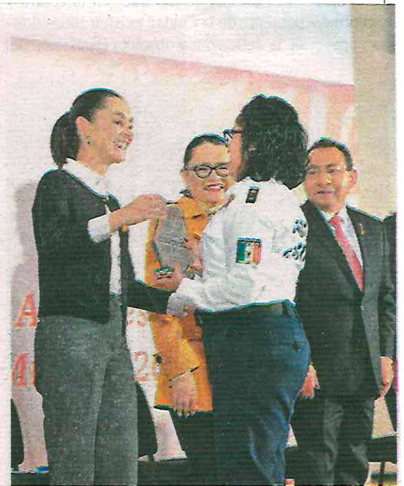
Mujeres policías recibieron un reconocimiento de manos de Claudia Sheinbaum

“Me quiero detener un poco en e Agrupamiento Ateneas, son mujeres que se han ido capacitando para proteger a mujeres, ellas son las que salen en las mar-