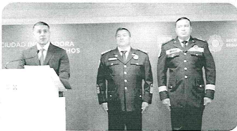
Omar García Harfuch dio los pormenores de la detención