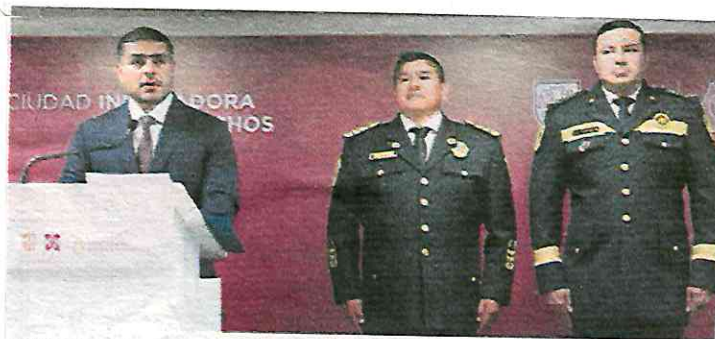
ANUNCIO. Omar García Harfuch, jefe de la Policía de Ciudad de México, ayer.

García Harfuch agregó que estos sujetos se alquilaban como sicarios y les pagaban 5 mil pesos y bonificación por cada delito de extorsión y asesinato cometido.