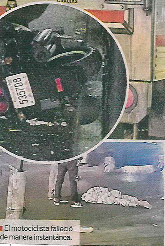
El motociclista falleció de manera instantánea.

Pasadas las 20:30 horas, peritos de la Fiscalía General de Justicia de la Ciudad levantaron el cuerpo para trasladarlo al anfiteatro para realizarle la necropsia de rigor, identificarlo y esperar a que sus familiares reclamen el cuerpo.