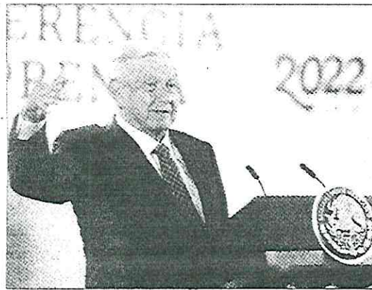
Andrés Manuel López Obrador agradeció a jóvenes y a la sociedad en general que hayan acudido a la marcha convocada por él.