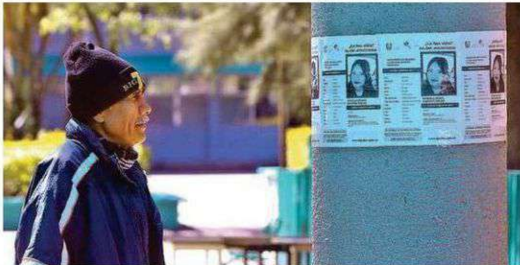
El Gobierno de la CdMx creó un Grupo Especializado de Apoyo, con facultades para intervenir de forma urgente durante el despliegue operativo de búsqueda