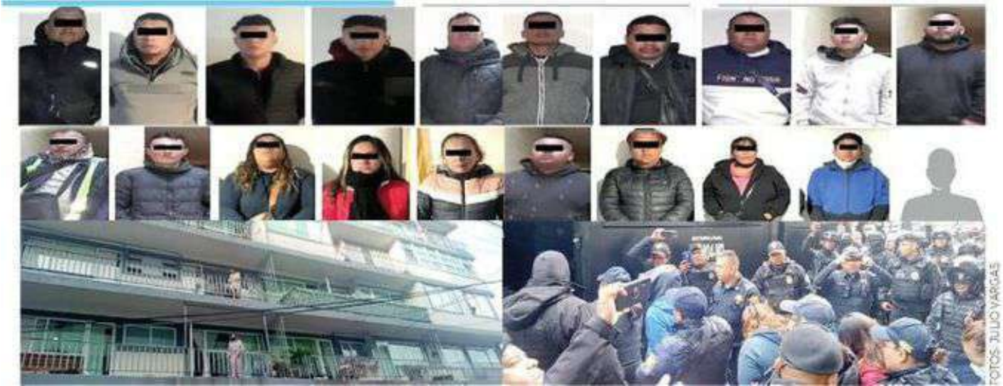
La policía intervino para salvar a los inquilinos