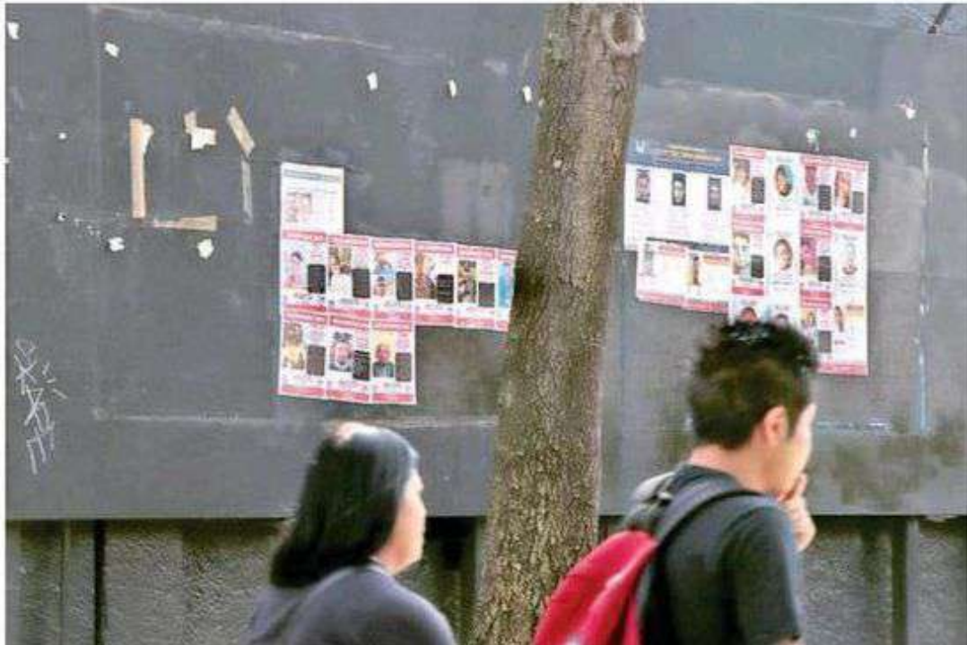
El Instituto para el Envejecimiento Digno se ha sumado a la iniciativa del Sistema de Búsqueda de la Ciudad