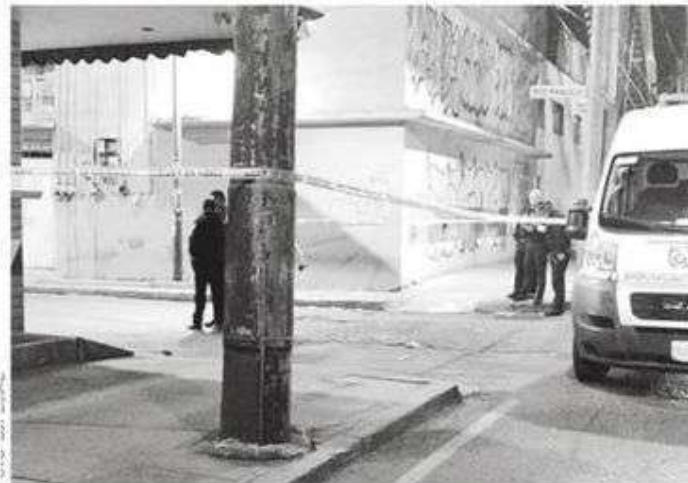
El escenario del enfrentamiento

Policías de investigación ya revisan las cámaras del CS para dar con el asesino