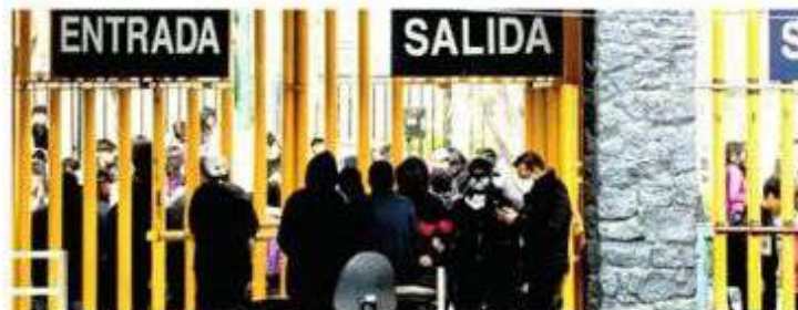
Elementos de la SSC resguardan las Instalaciones

Denuncian casos de acoso sexual que han ocurrido