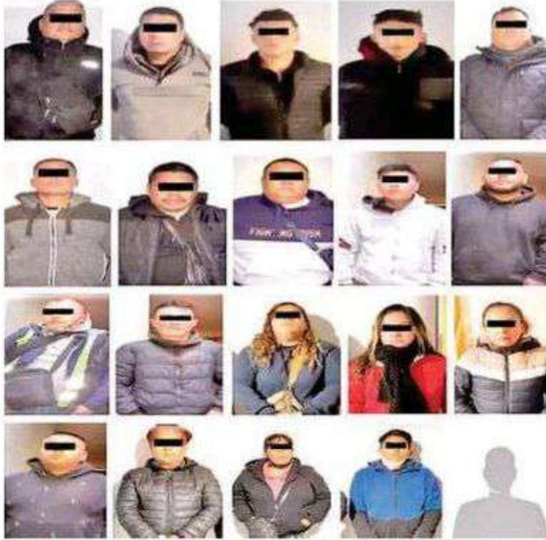
Muy de mañana intentaron sacar a las familias del edificio; fueron trasladados a la FGI

Serán las autoridades las que determinen la situación jurídica de los imputados luego de las investigaciones pertinentes, y tras llevar a cabo las diversas etapas de su proceso legal.