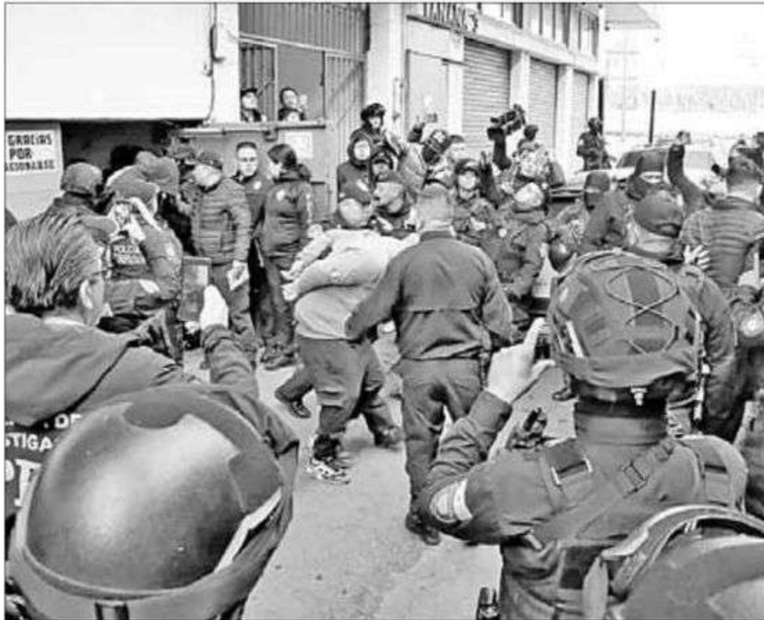
▲ Veinte personas fueron detenidas por policías luego de que intentaran desalojar por segunda ocasión a los habitantes de un departamento en la colonia Narvarte.