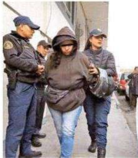
Un fuerte dispositivo de seguridad se desplegó en la zona, con patrullas y camiones costeros, la mujer se había ocultado en el baño del estacionamiento