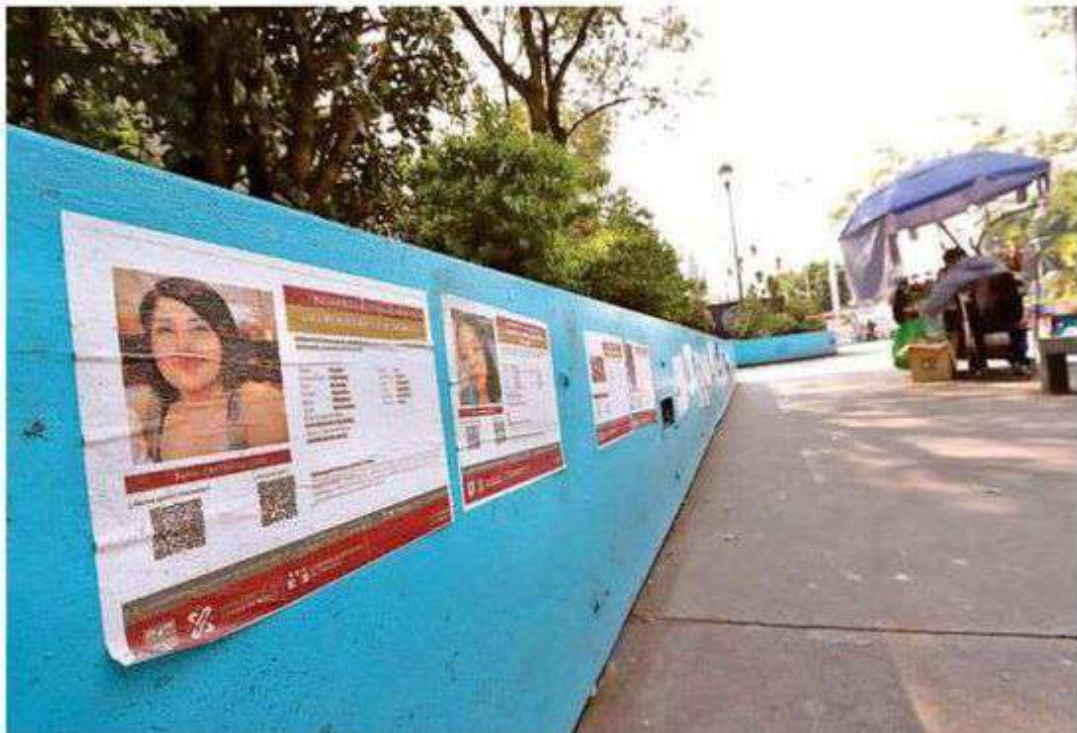
Como resultado de los esfuerzos de vinculación con autoridades y sociedad, se han establecido convenios y mecanismos de coordinación con instancias