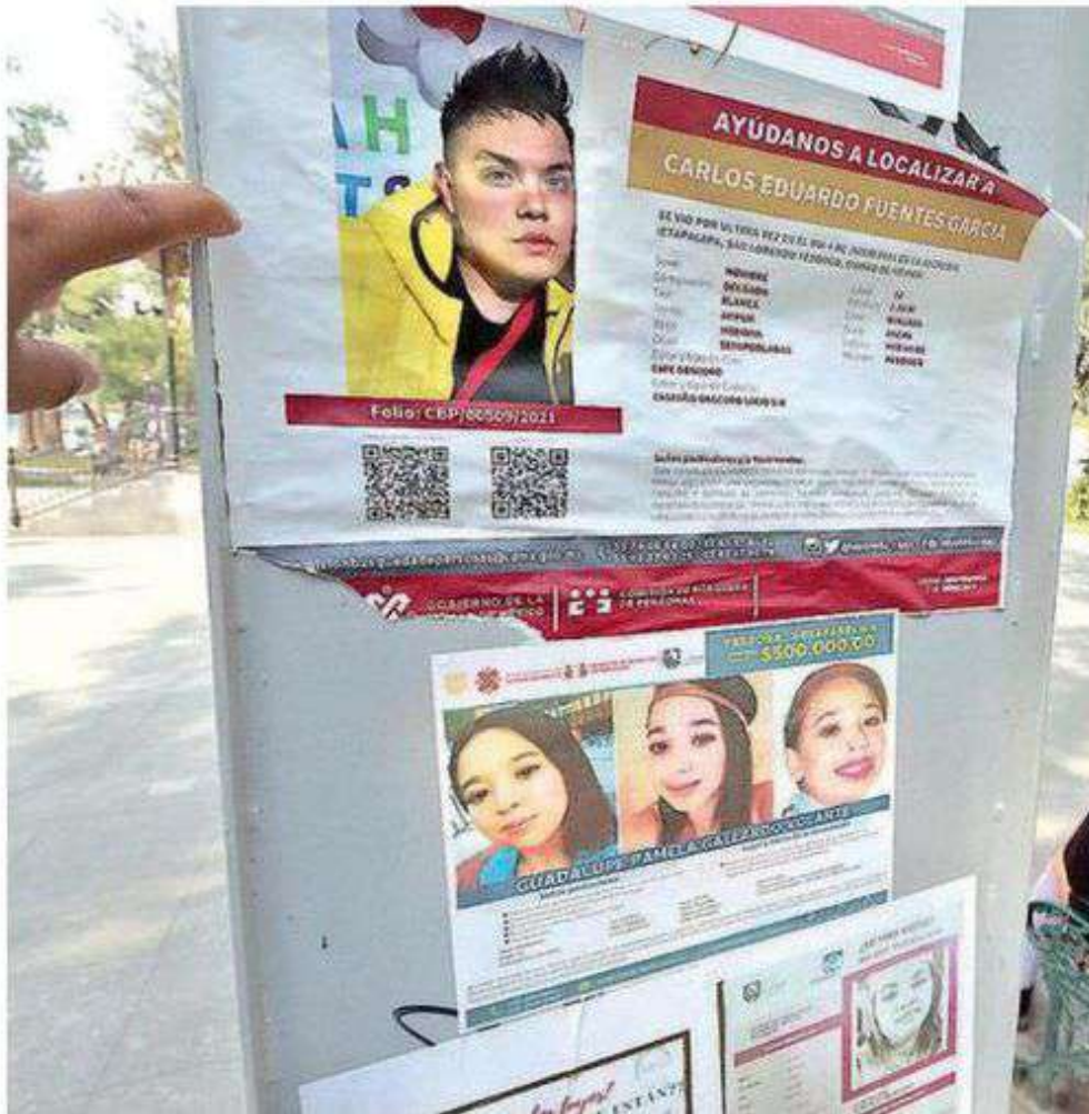
El Grupo Especializado de Apoyo de Búsqueda de Personas Desaparecidas participó en 800 acciones de búsqueda, logrando la localización de 400 personas