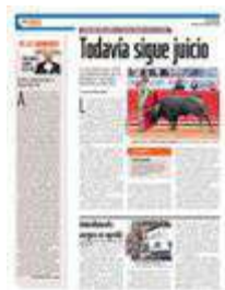
En las puertas del Coso hubo varias agresiones a fanáticos del toro.