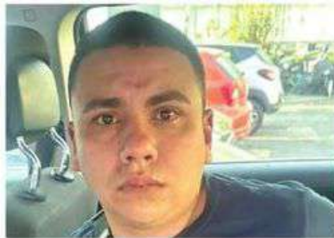
Lo atraparon en su guarida