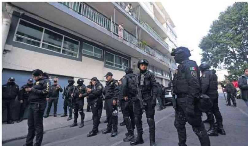
Elementos de la SSC llegaron a la calle de Tanana, en la alcaldía BJ, donde detuvieron a 13 hombres y siete mujeres, una menor de edad.

Los vecinos señalaron que no es la primera vez que había llegado ese grupo, pues el pasado 23 de enero ya los habían amedrentado, aunque no pasó a mayores. ●