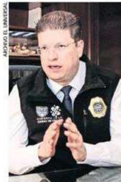
El jefe de la policía informó la detención del autor intelectual del asesinato de agente de la SSC.

Con base en la información que logró recopilar el oficial de inteligencia se sabe que esta célula criminal se extendía con rapidez hacia las alcaldías Venustiano Carranza y Benito Juárez, en las que también ya se dedicaban a la venta de drogas al menudeo, lo que —a decir de la proyección de la SSC-CDMX— se convertiría en una situación de riesgo para los capitalinos. ●