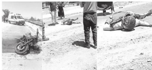
La escena era desgarradora

Al parecer el motociclista conducía a exceso de velocidad-