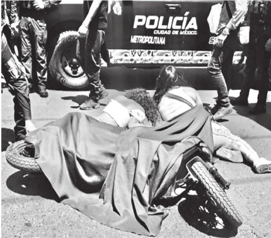
La madre del menor no daba crédito a lo sucedido