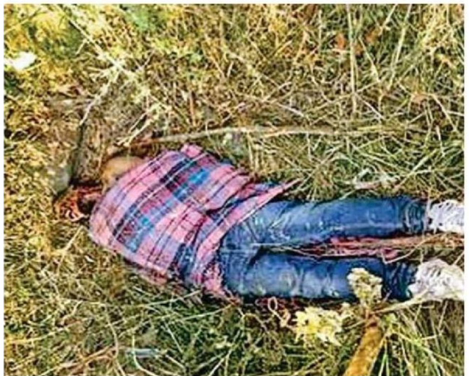
Existe la sospecha de que estas muertes puedan estar relacionadas con la actividad ilícita de los talamontes en Milpa Alta