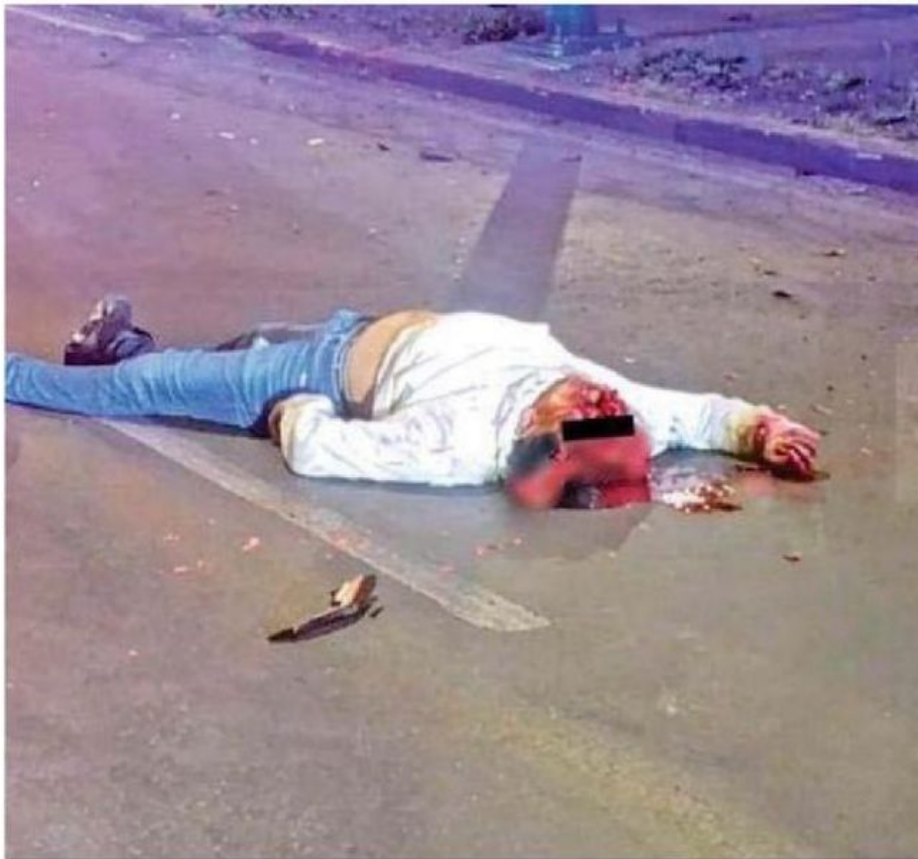
La víctima , cuya identidad no ha sido revelada, se partió el cráneo luego del fuerte impacto