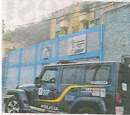
La Casa Madre Teresa quedó bajo resguardo de la Secretaría de Seguridad Ciudadana