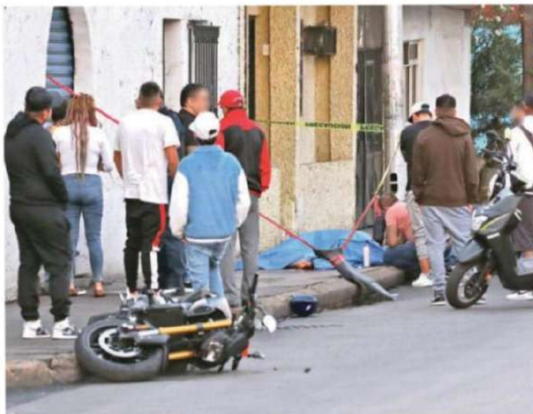
El biker circulaba sobre el Circuito Interior con dirección a la Raza

Testigos de los hechos que cruzaban por el lugar al momento del accidente dieron aviso a las autoridades, monitoristas de las cámaras de la ciudad verificaron la emergencia y movilizaron a elementos de