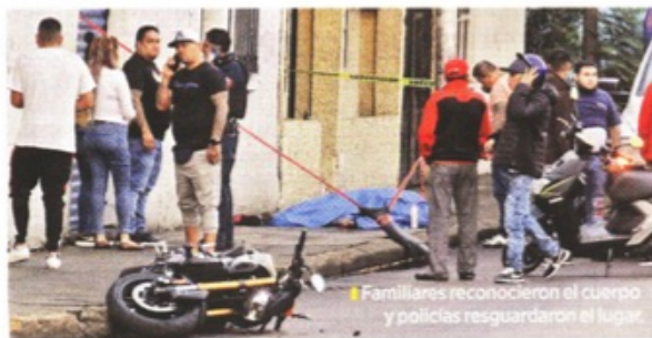
Familiares reconocieron el cuerpo y policías resguardaron el lugar.